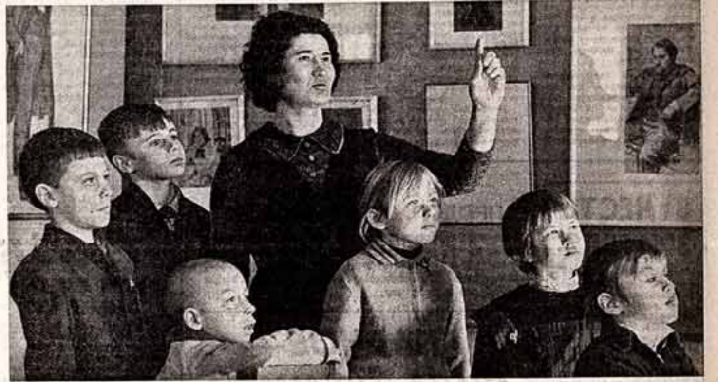
В Верхневолжье, недалеко от Калининграда, в колхозе имени ХХII съезда КПСС, вот уже 9 лет работает миниатюрная и летняя картинная галерея...