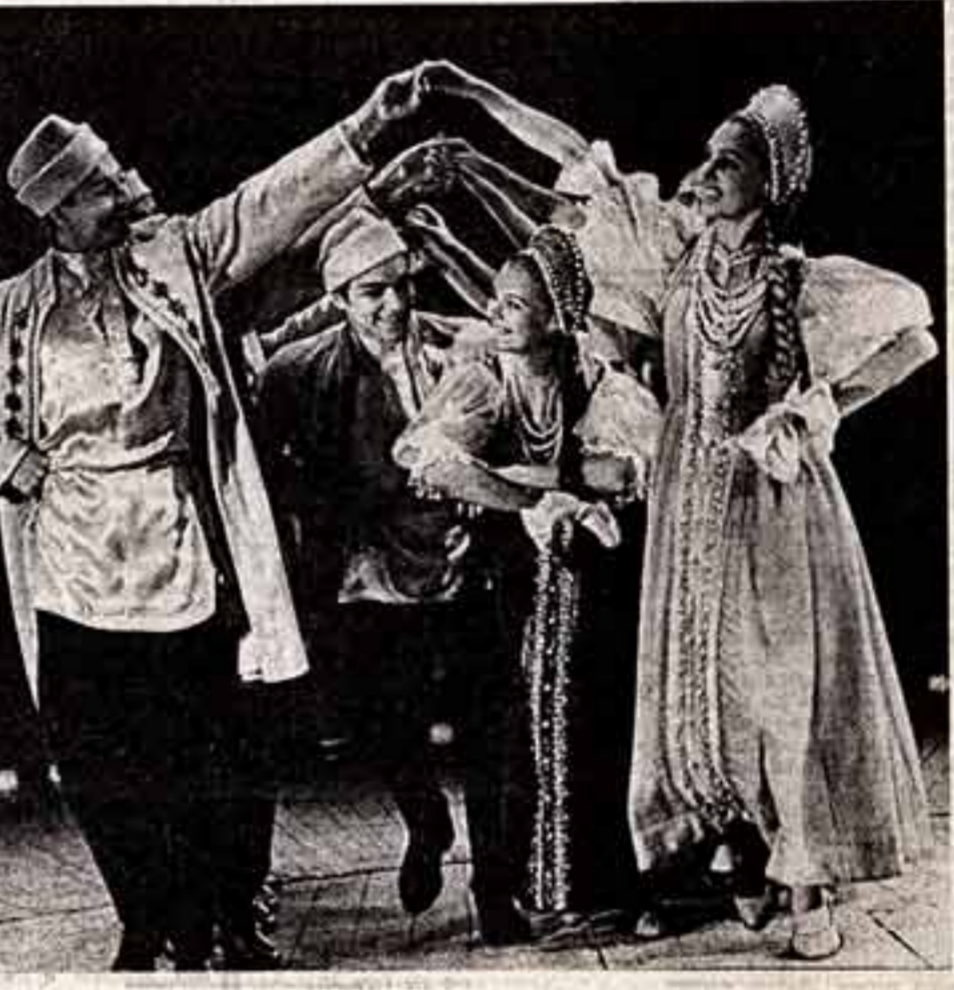
фотоконкурс Мирислея МУРАВОВА. Тянут юнессию.