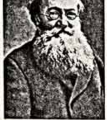
П. А. Кропоткин.