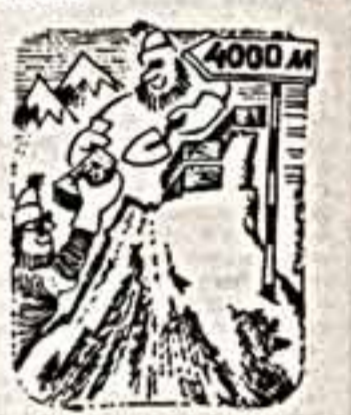
В связи с этим советским бизнесменом города Злат Гурта решил выстроить вершину еще на 23 метра, чтобы она стала 33-м швейцарским четырехтысячником и по-прежнему принадлежала к стране альпийцев.