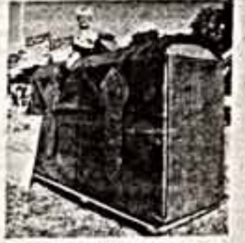
На этот раз здесь можно было увидеть и самую большую в мире нефелиниту, способную за один раз смолот пять килограммов кофе...