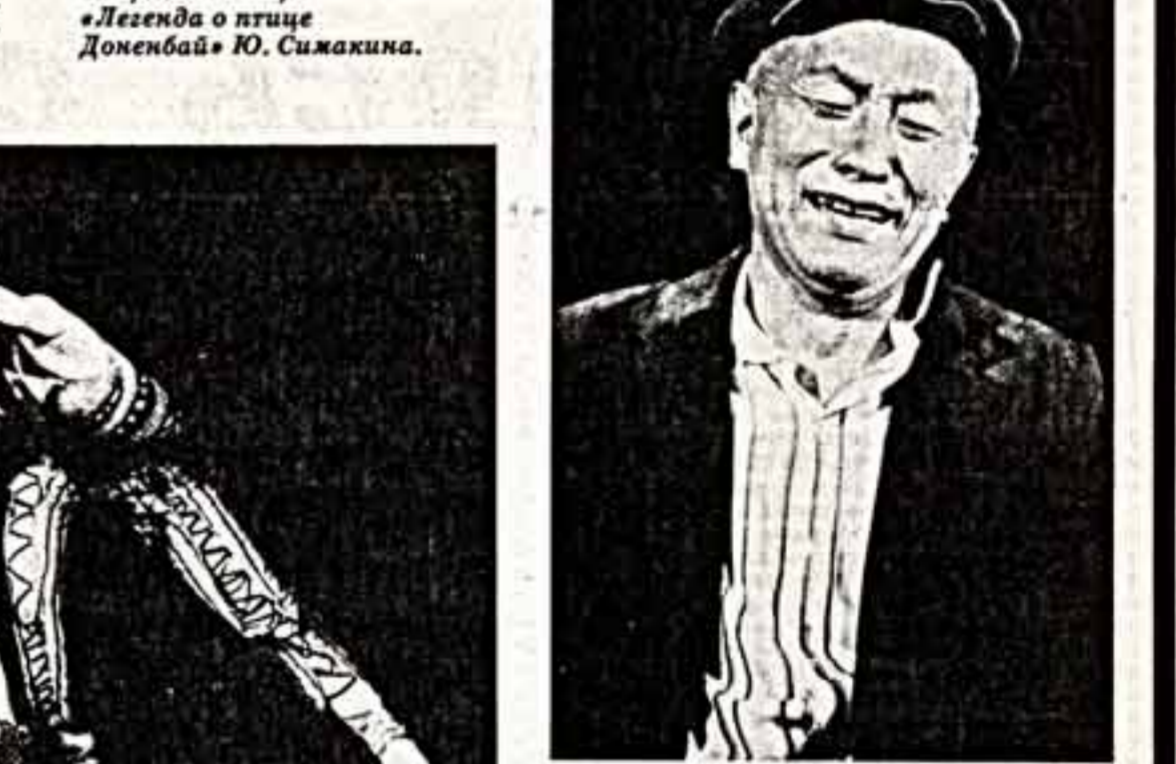
Бостон — народный артист Кир. ССР А. Умуралиев.