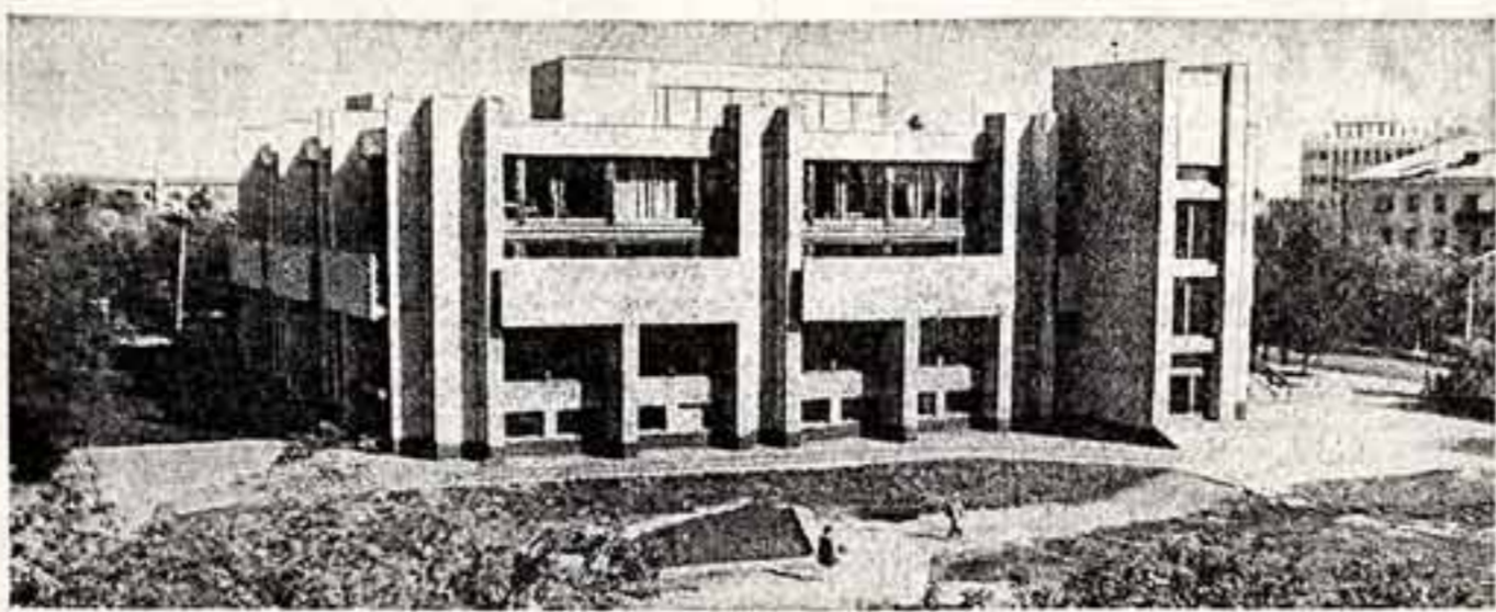
Недавно в новое здание переехала Центральная областная библиотека имени Л. И. Толстого в Кутаисе. Ее фонд составляет 340 тысяч томов.

Эффективное использование возможностей сельского хозяйства самым непосредственным образом связано с решением социальных проблем деревни.