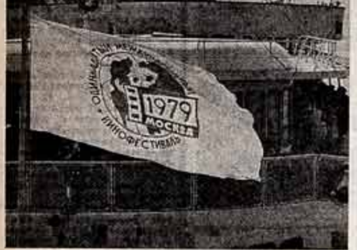
На флажке теплохода флаг фестиваля.