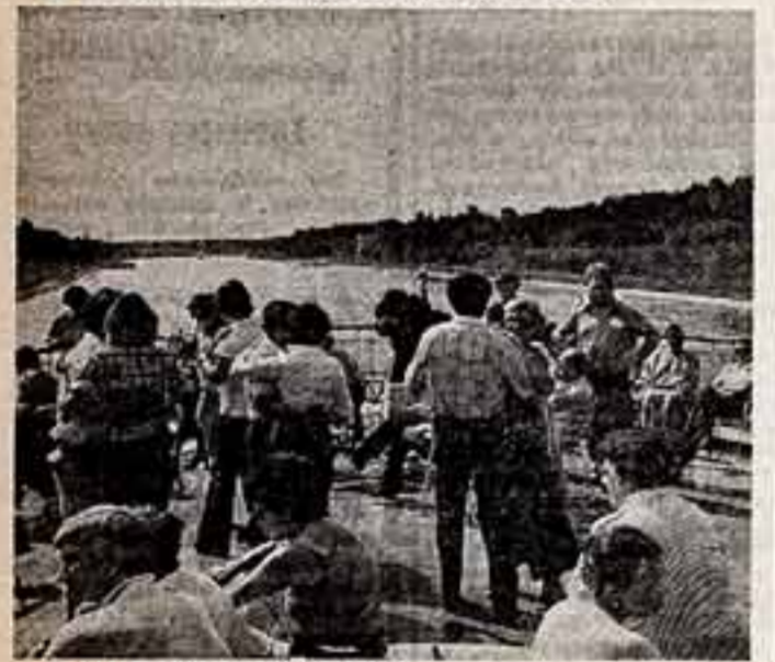
Танцы на верхней палубе.