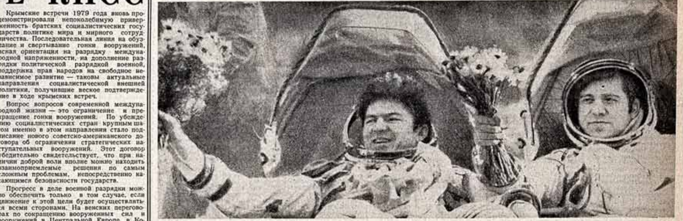
Космонавты на родной земле.

Ученым, конструкторам, инженерам, техникам и рабочим, всем коллективам и организациям, принимавшим участие в подготовке и осуществлении длительного космического полета на орбитальном научно-исследовательском комплексе «Салют-6» — «Союз»