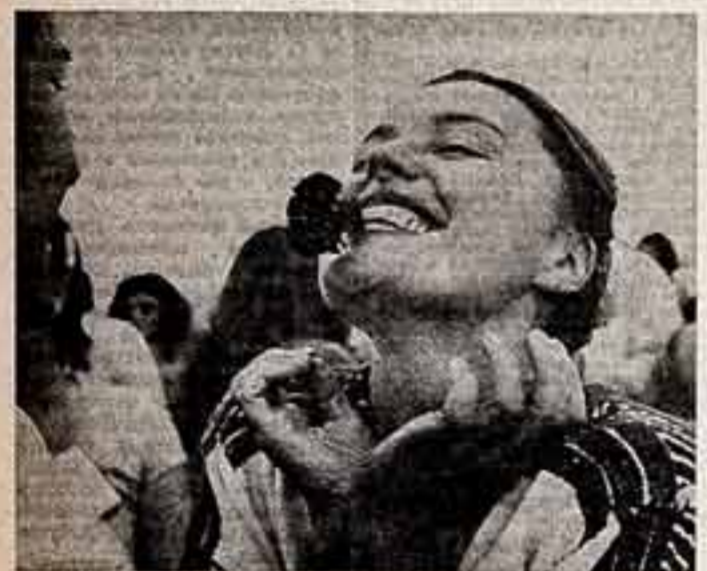
В пятницу воскресные участники в гости фестиваля совершили прогулку на теплоходе по каналу имени Москвы.