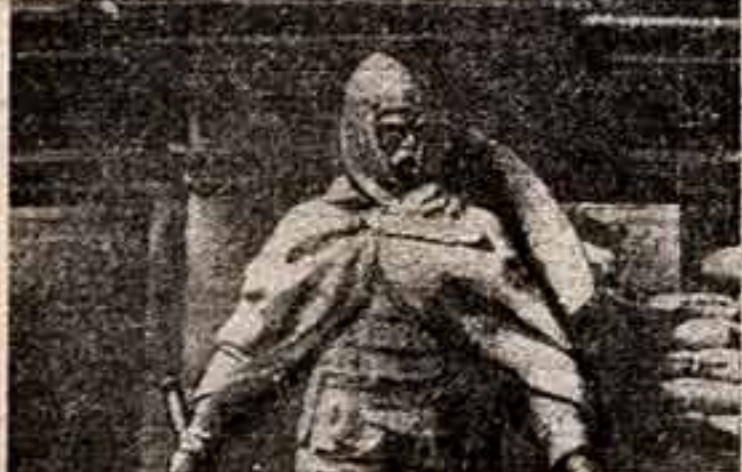
Из по злой воле пришел в Древнюю немецкую столицу... и стимом доблестей советский солдат с винтовкой. Пришел и сказал о том морочи, но, не, все.