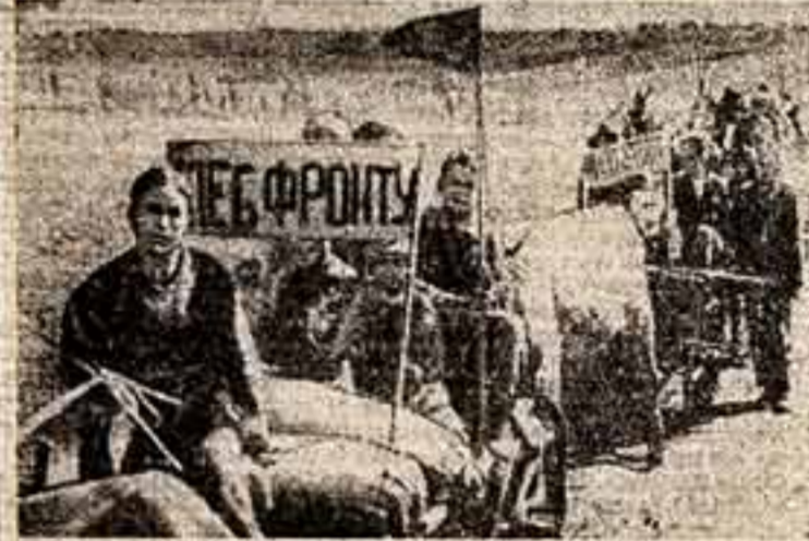
На фронте symbolic, стим, музика, им нужен хлеб. Из тысяч русских деревень, выданных родными руками, идет он на фронт.