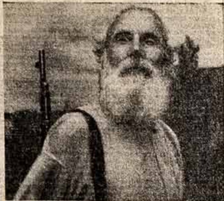
Нет, никогда и никому не покорить этого народа!