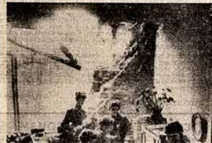
Грохот войны, разрывы, смерть, кровь... и Чайковский. Что это было — «Первый концерт»? «Времена года»?