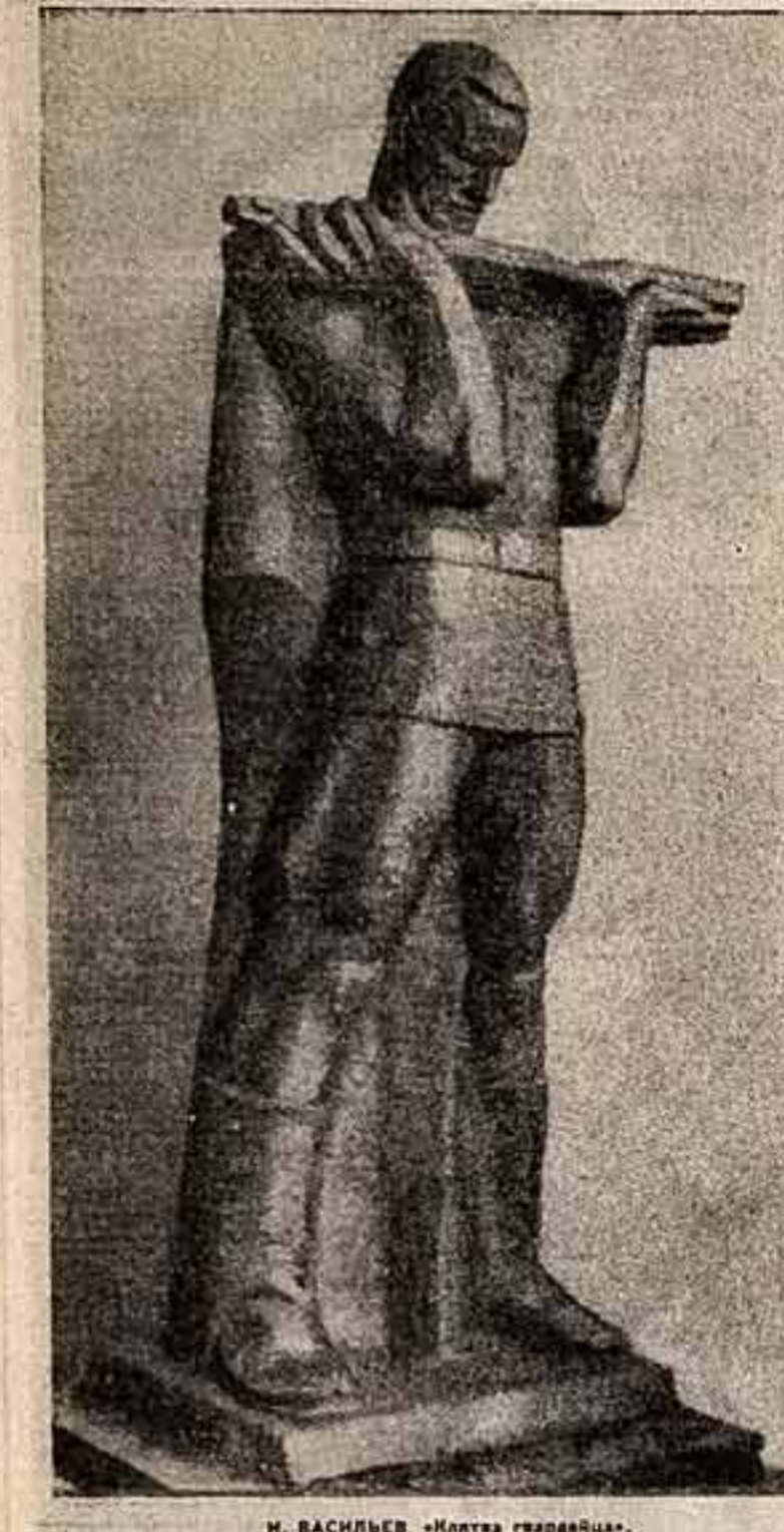
М. ВАСИЛЬЕВ. «Малка гвардейца».

Большинство снимков, вошедших в книгу, перекопало в нее со страниц центральных, фронтовых, армейских газет, где они впервые были напечатаны.