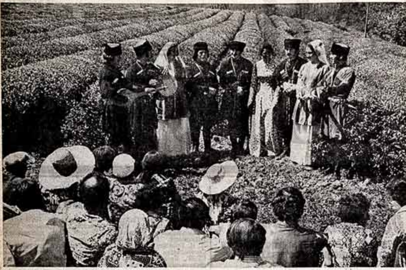
Лайтурская чайная совхоз-техникум имени С. М. Кирова Магаратского района — одно из крупнейших в Грузии субтропических хозяйств. Под чай здесь занято 987 гектаров. Лайтурские обещают продать государству 73 тысячи центнеров сортового листа.

Каждое воскресенье в назначенный срок «Сельский час» собирает свою аудиторию. Так продолжается уже седьмой год. За это время определены наиболее эффективные приемы раскрытия сельской темы.