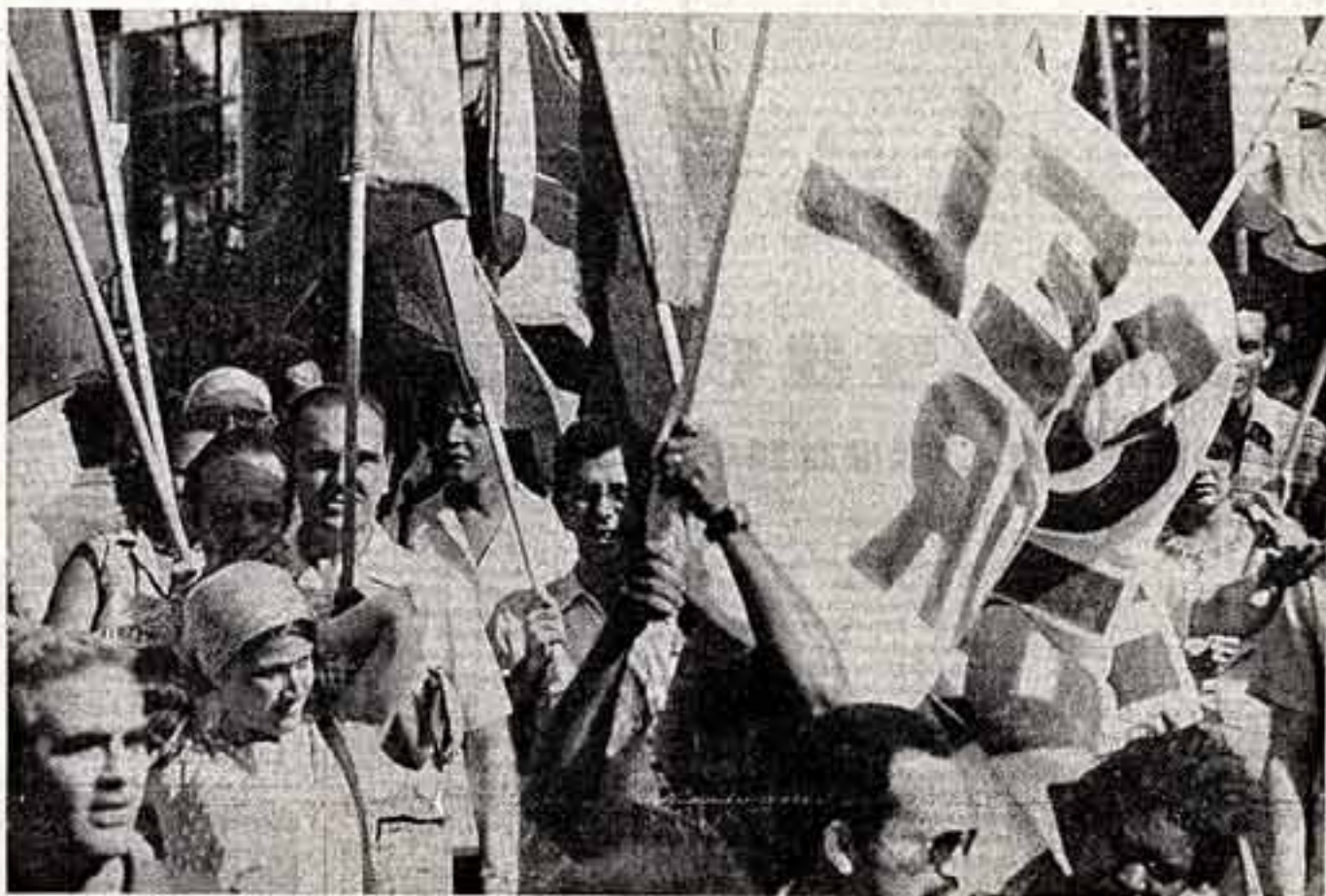
НА МАРШРУТАХ УРОЖАЯ