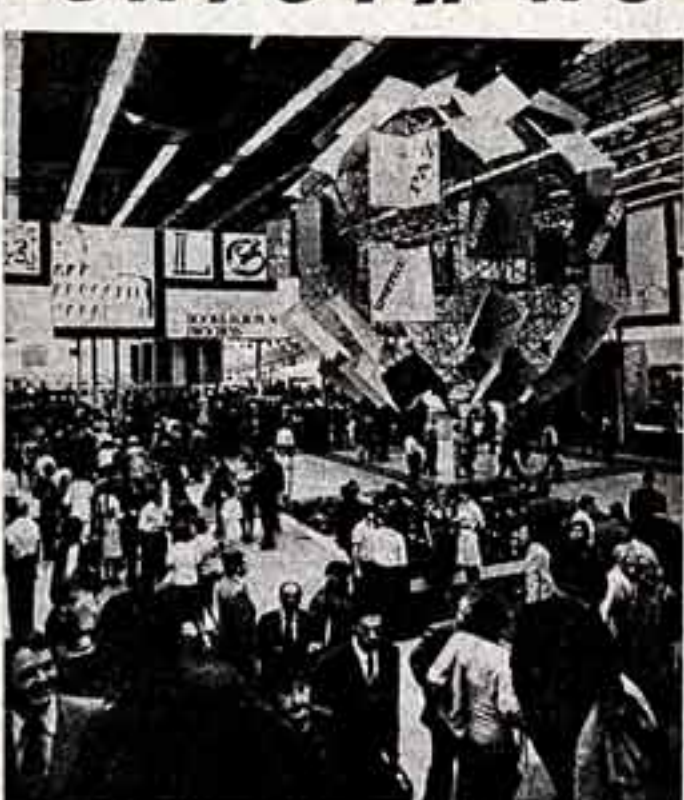
Международные симпозиумы, выставки, ярмарки стали в Москве привычным делом, как и это — первая Международная книжная выставка-ярмарка.

формацией, контактов и т. п., якобы Советским Союзом не выполняются. О том, как в действительности обстоит дело, о значении хельсинских договоренностей для развития международных культурных связей и обмена, свое мнение по просьбе корреспондента АПН Николая МЕЩЕРЯКОВА высказывают руководители ряда государственных организаций СССР.