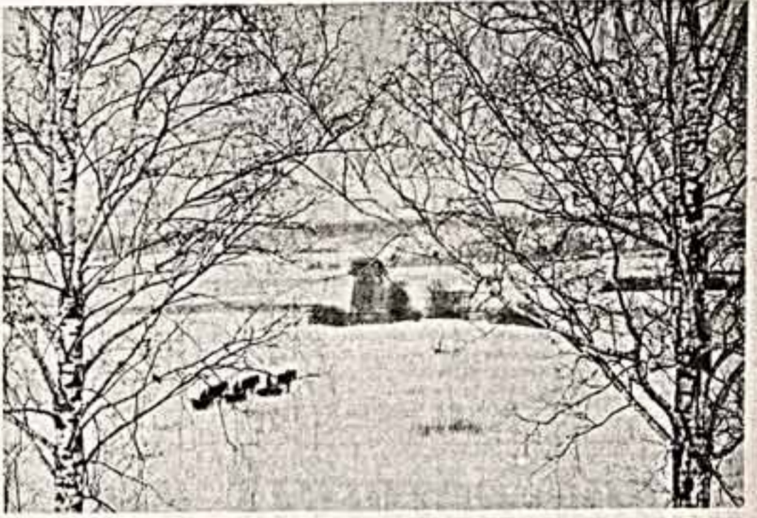
Зима в Михайловском.