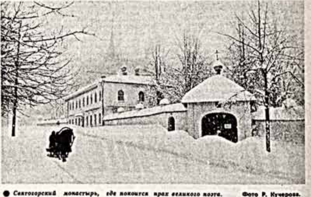
Светогорский колхозист, где похитил враз великого поэта.