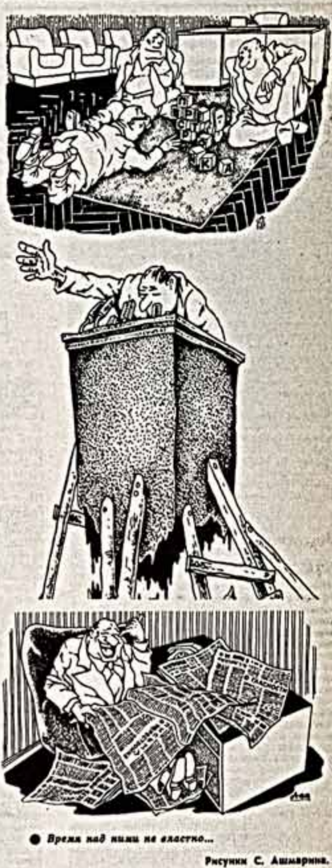
Время над нами не властно...