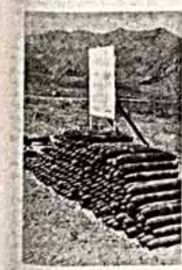
ХАРАКТЕРНЫЙ шелестящий звук проносится над афганской столицей. Жители Кабула и нему уже привыкли, они знают — раз ты его услышал, значит все в порядке, ты останешься жив. Но где-то подальше — и это неизбежно — звук кончается негромким хлопком взрыва. Валетомкий вверх желтый сдутан пыли из разрушенного прямого попадания реактивного снаряда глинобитного домика, леденящие душу крики перепуганных детей — тех, кто остался в живых, окровавленное тело матери в ночной рубашке, которая так и не проснулась, зажимающая рану в плече отцу, пытающийся понять в этом аду, что же собственно произошло, сбегающие на помощь соседи... А через некое время — завывания sireны «скорой помощи», пожарники, тушащие языки огня, скорбующий плач по убитым безымянным людям, гневные возгласы в адрес тех, кто чуть ли не ежедневно посылает слепые реактивные снаряды во все районы города. Очередная, страшная в