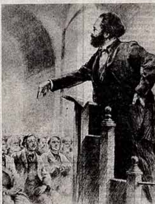
К. Маркс читает лекцию в лондонском Прогрессительном обществе немецких рабочих (начало 60-х годов). Рисунки Н. Жукова для книги «Воспоминания о Марксе и Энгельсе».