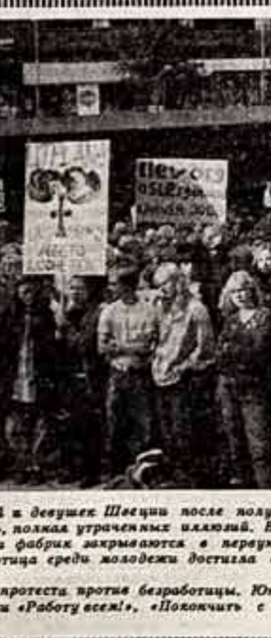
Массовая манифестация протеста против безработицы. Юноши и девушки выжили на улицах Стокгольма с плакатами «Работу всем!».