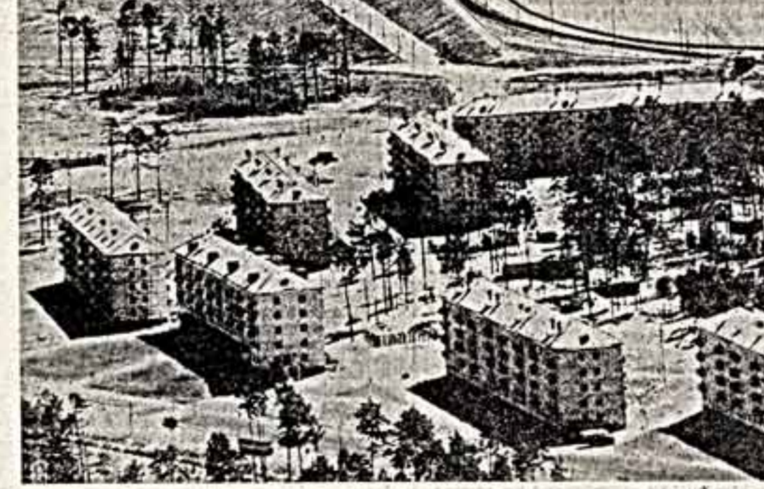
Завершиной — ближайшая к Падунским порогам станция магистральной Тайшет — Лена.

— Сегодня в Братске, — продолжал секретарь