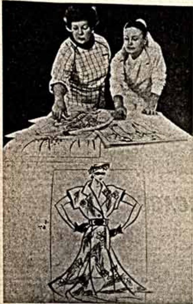
Республиканский Дом моделей швейных изделий... Уже разрабатывается коллекция на 1987 год...