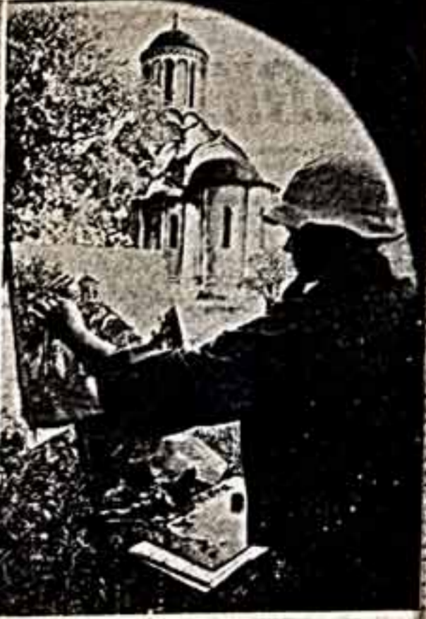
В сентябре с. г. исполнилось 625 лет со дня рождения Андрея Рублева. На этих снимках — бывший Андроников монастырь, ныне Музей древнерусской живописи, косящий имя залечательного русского художника, ваяльщик смл в уголок территории.