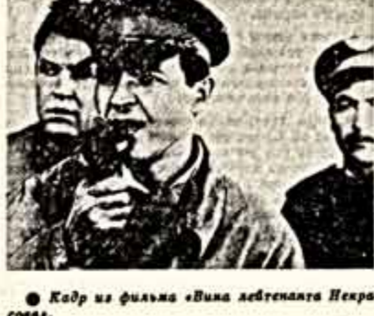
Кадр из фильма «Вина лейтенанта Некрасова».