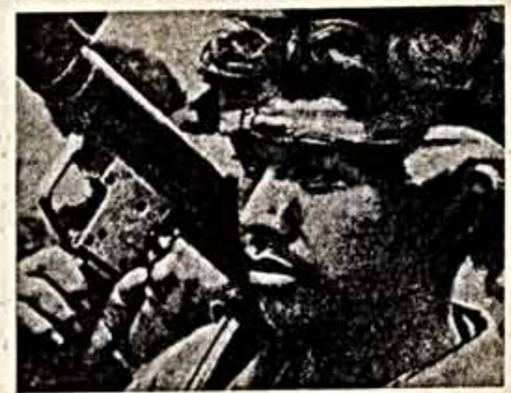
Финансирование и контроль американским ЦРУ радиостанции широким фронтом ведут масштабную борьбу с народными радиостанциями.