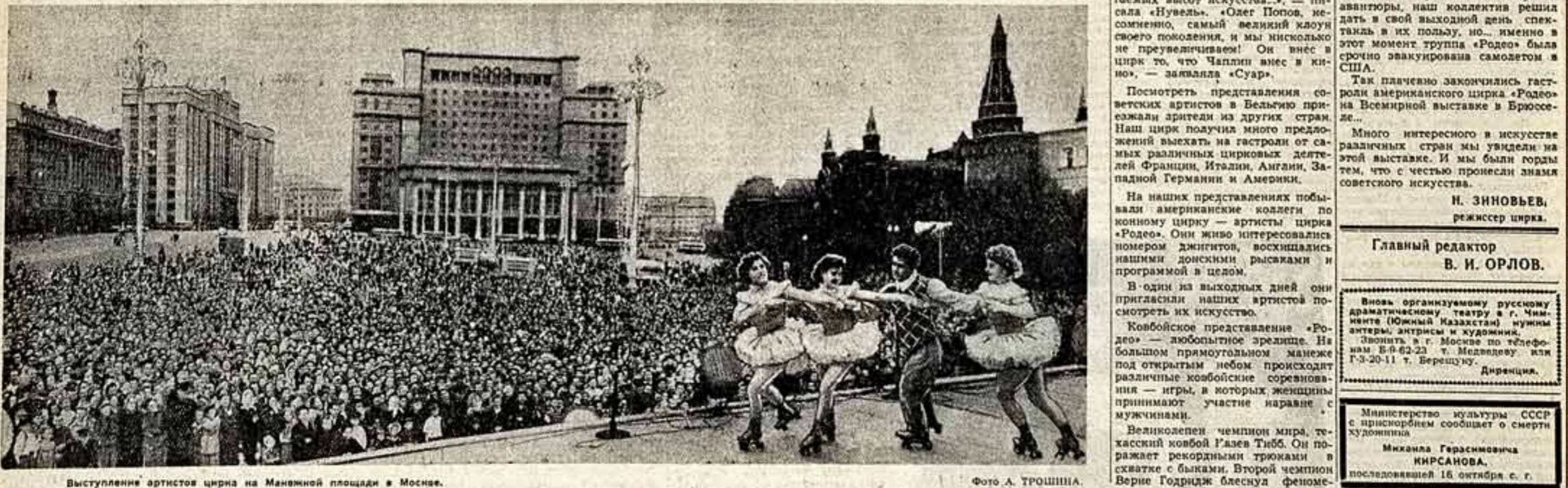
Выступление артистов цирка на Манежной площади в Москве.

Ваше выступление было просто великолепно! Мы все восхищались и аплодировали. Спасибо вам за это прекрасное искусство.