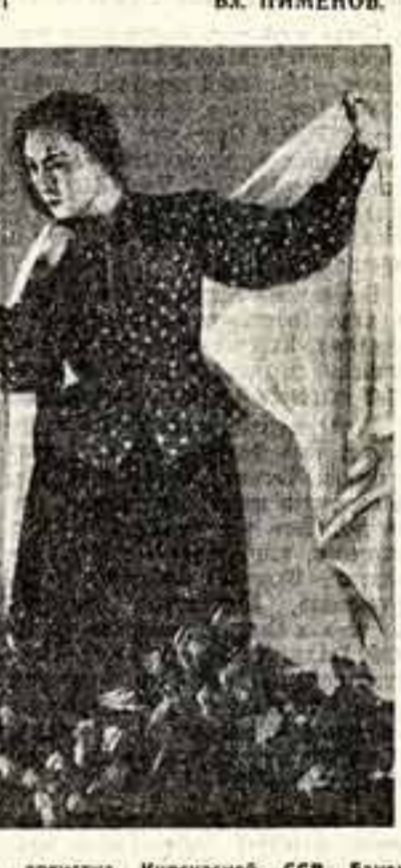
Народная артистка Киргизской ССР Вакин Калмыцкова в роли Катерины.

«Гроза» может и должна удерживать в репертуаре Киргизского драматического театра, а удерживать — это значит дальше расти. Мы надеемся, что, сохранив все лучшее, уже найденное в спектакле, коллектив Киргизского театра вернется к работе над ним, к раздумьям над судьбой Катерины и окружающего ее стемного парства».