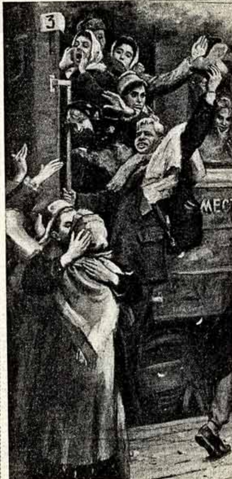
Е. Горюхов. «В жизни». Выставка «40 лет ВЛКСМ».