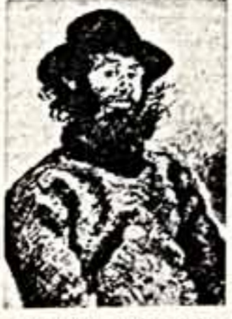
К. МОНЕ. «Пол, рыбак и Валь-Иль».

● Кто украл «Культиватор»? Репортаж Сообщения важности из области сельского хозяйства Мэриэттан (стр. 7).