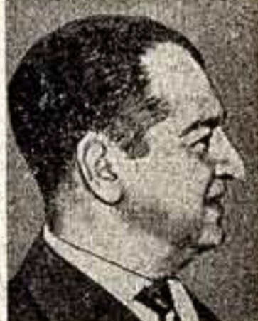
Хорхе Саламеа Борда — писатель, общественный деятель (Колумбия).