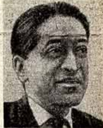
Ромеш Чандра — генеральный секретарь Всемирного Совета Мира (Индия).