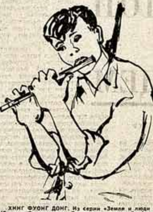
ХИНГ ФУОНГ ДОНГ. Из серии «Земля и люди Южного Вьетнама».