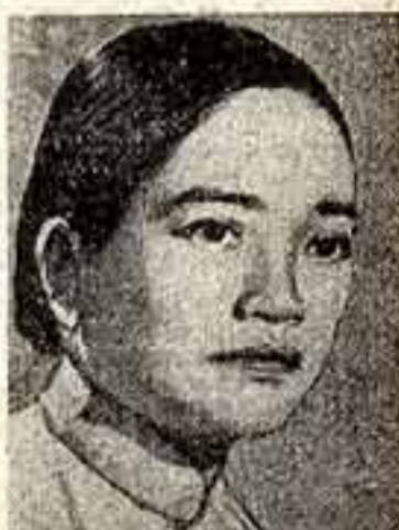
Нгуен Тхи Динь — общественная и политическая деятельница (Южный Вьетнам).