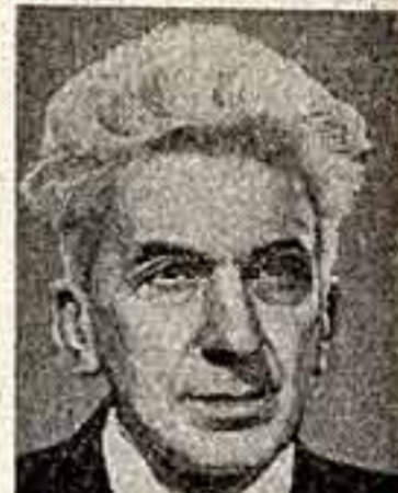
Эндре Шинк — ученый, общественный деятель (Венгерская Народная Республика).