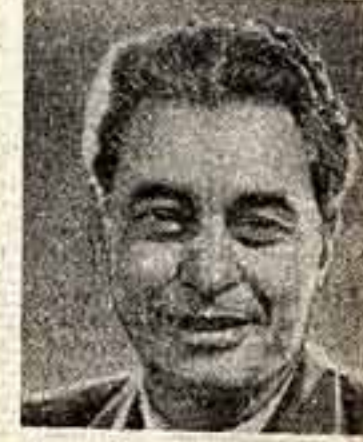
Йорис Иаенс — кинорежиссер, общественный деятель (Нидерланды).