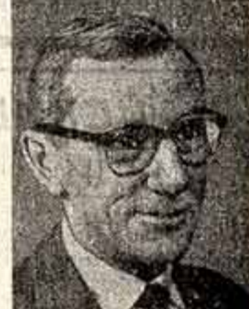
Жан Эффель (Франсуа Лежен) — художник, общественный деятель (Франция).