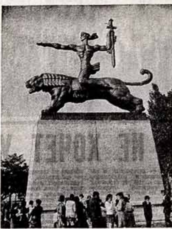
Монумент Победы в г. Гори.