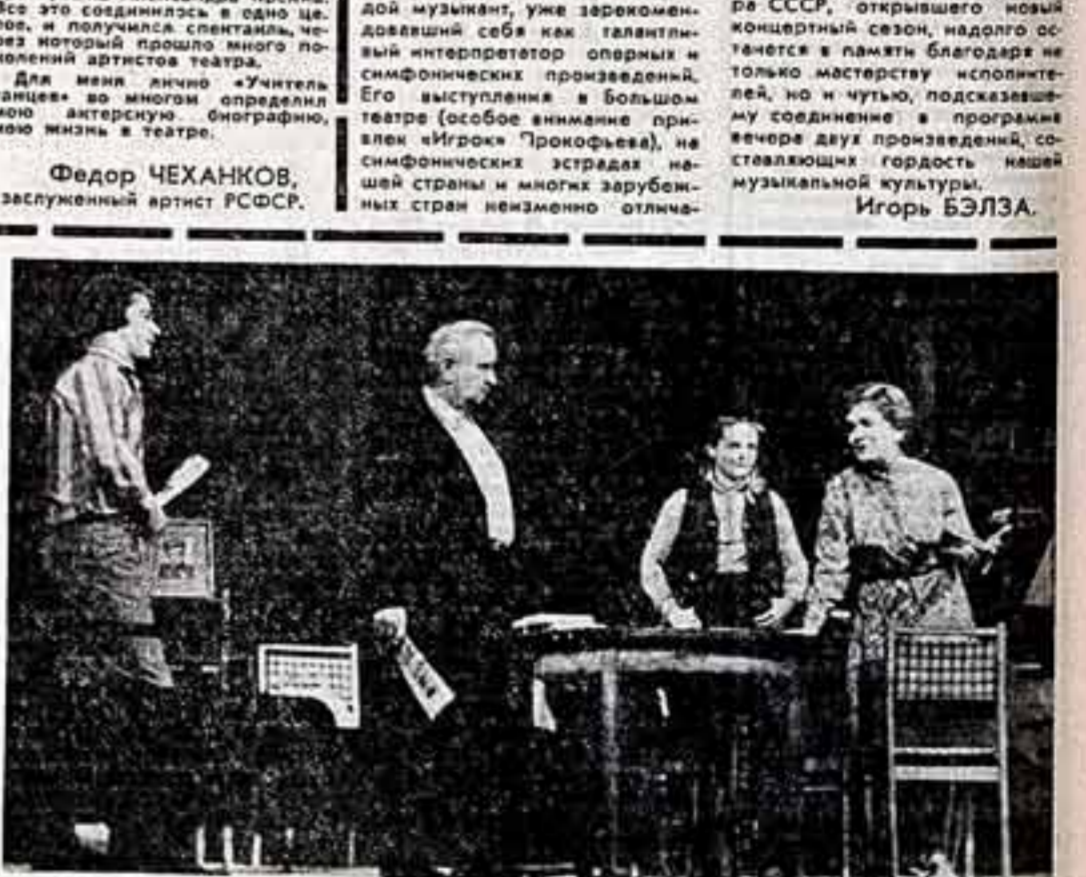
Беседа вел Э. ГРАФОВ.