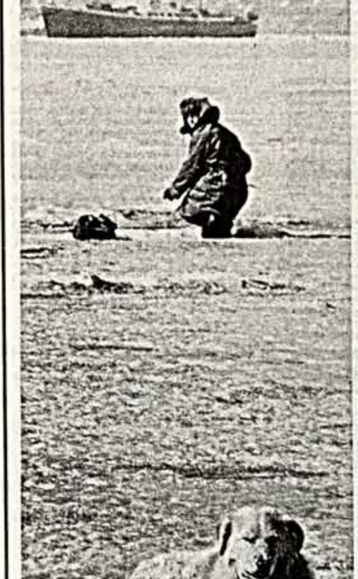
В. МАТБЕЗ. (Масовия). «В зимней делье»