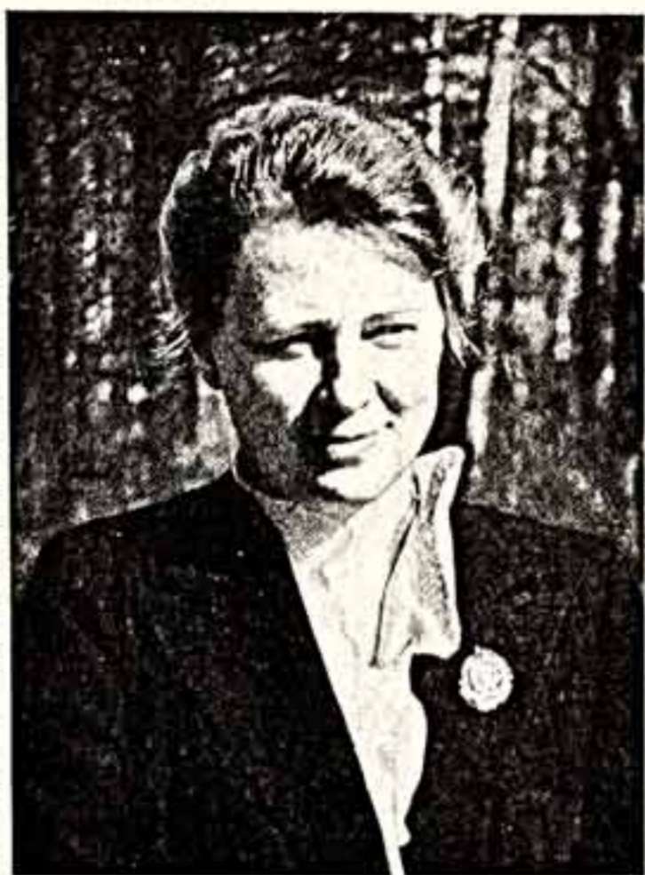
Алла Константиновна Тарасова. 1942 год.

Сегодня впервые публикуется письмо из хранилища в Музее МХАТа архива А. К. Тарасовой.