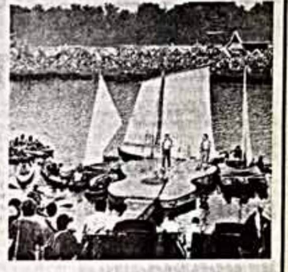
Кубышевская область. Это зрелище запомнится надолго. Более 75 тысяч участников собрались на пятнадцатый, пятидесятый по счету туристский фестиваль патристической песни имени Валерия Грушина...