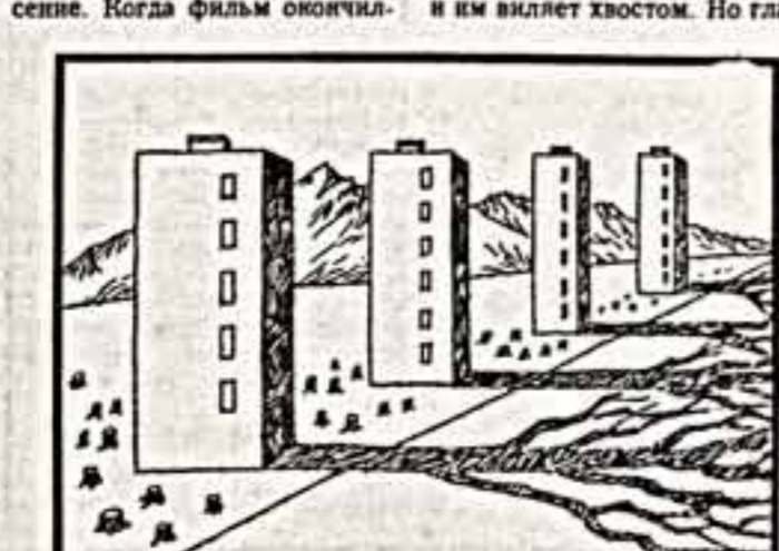
Это правда, что в нашей институте ничего не делается, но это происходит на строго научной основе...