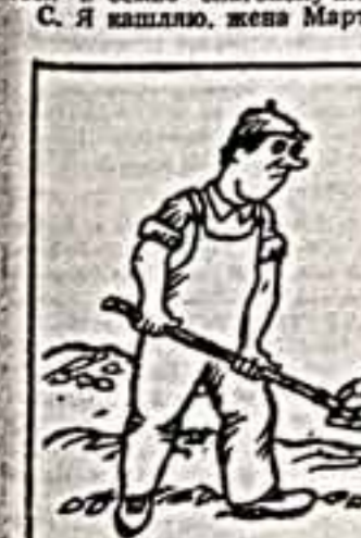
Нельзя работать по-старому, вот тебе новая лопата.

К. Это что-то новое в твоём отношении к молодежи.