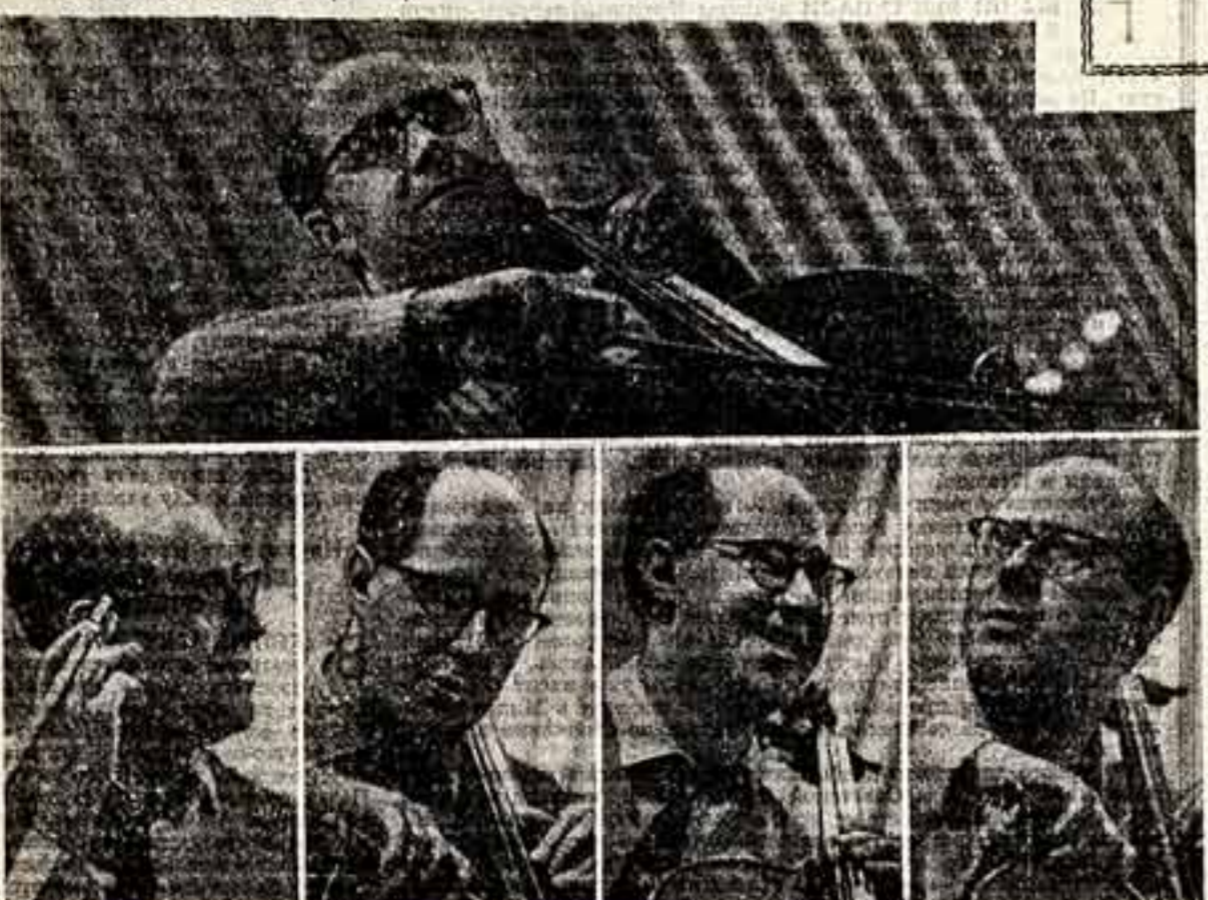
Эти симфонии владимиром Ростроповичем на рояль в Государственном симфоническом оркестре СССР.

РОСТРОПОВИЧ — необычайное явление в современном исполнительском искусстве. Его творчество открывает новую страницу в истории мировой музыки. Достижения его феноменального таланта можно изучать и изучать будут еще долго. Великий, кто достиг с искусством Менделеева Ростропович, в творчестве достиг в искусстве Ашхабадского. Действительно, в творчестве Ростроповича с особенной отчетливостью проявились черты, предельно близкие современному художнику.