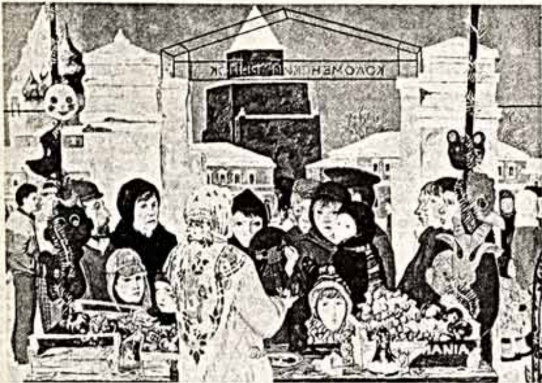
Е. ПОПОВА. «База́р».

2-3 картины одного художника, их раскидывали по разным стенкам. «Тут не персональная выставка», — вешал выставкам. Сегодня баланс должен сместиться в сторону личности художника.