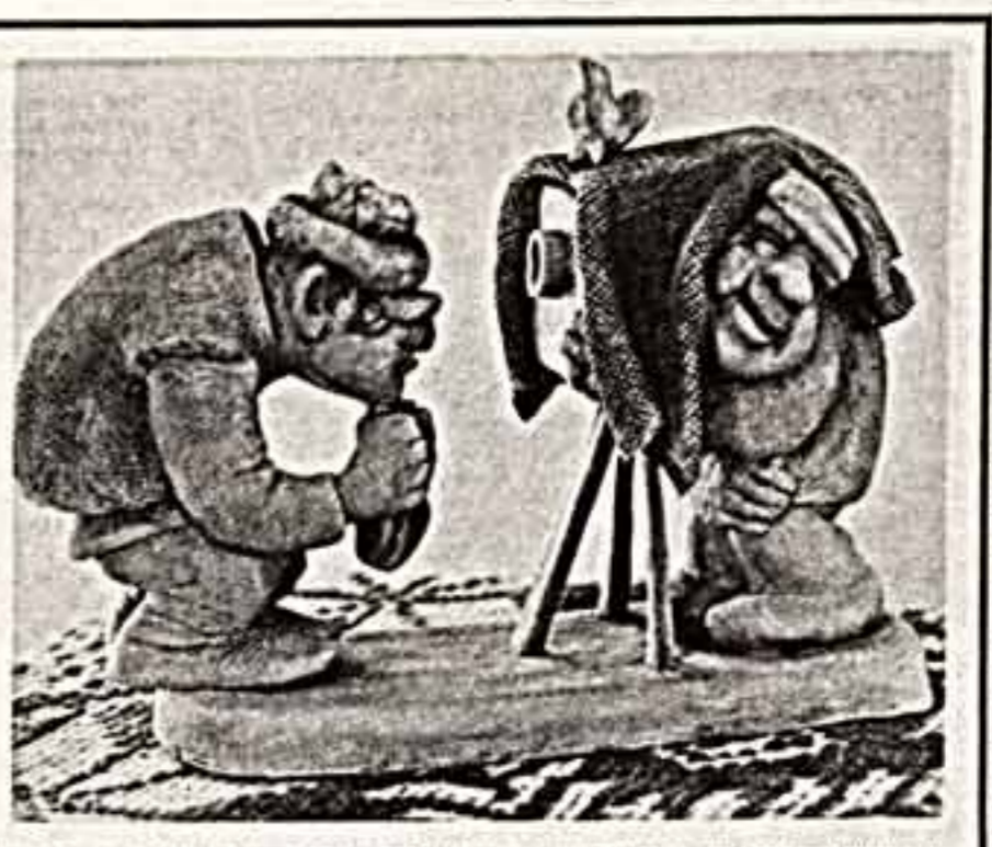
живной, с улыбкой рассказ про людей белорусского Полесья, их дела, обычаи, характеры. Уроженки М. И. Пушкар со своими замечательными работами. Работа М. И. Пушкар «Сельский фотограф».