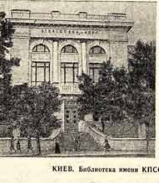
КИЕВ. Библиотека имени КПСС. Новый кинотеатр «Киев».

Государственное издательство политической литературы издало отдельной брошюрой речь Председателя Совета Министров Союза ССР товарища Г. М. Маленкова на Пятой сессии Верховного Совета СССР. Брошюра выпускается тиражом в 5 миллионов экземпляров. (ТАСС).