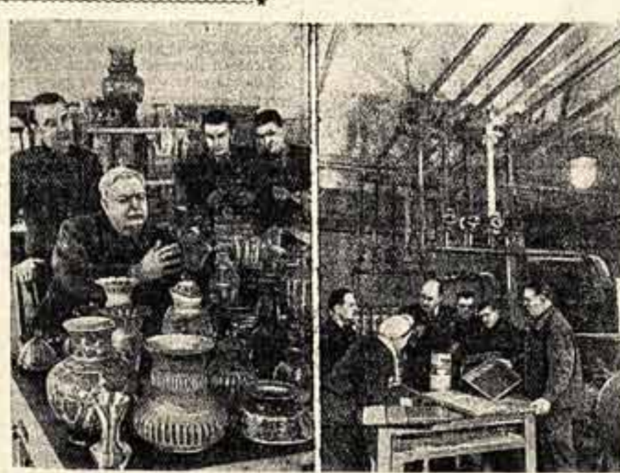
Ученые Ленинградского технологического института им. Ленсовета на предприятии:

Экспонат выставки будут обобщены при участии покупателей, представителей музыкальной общественности и торгующих организаций столицы. Их критические замечания помогут коллективному предприятию в борьбе за дальнейшее повышение качества музыкальных инструментов и лучшее их оформление.