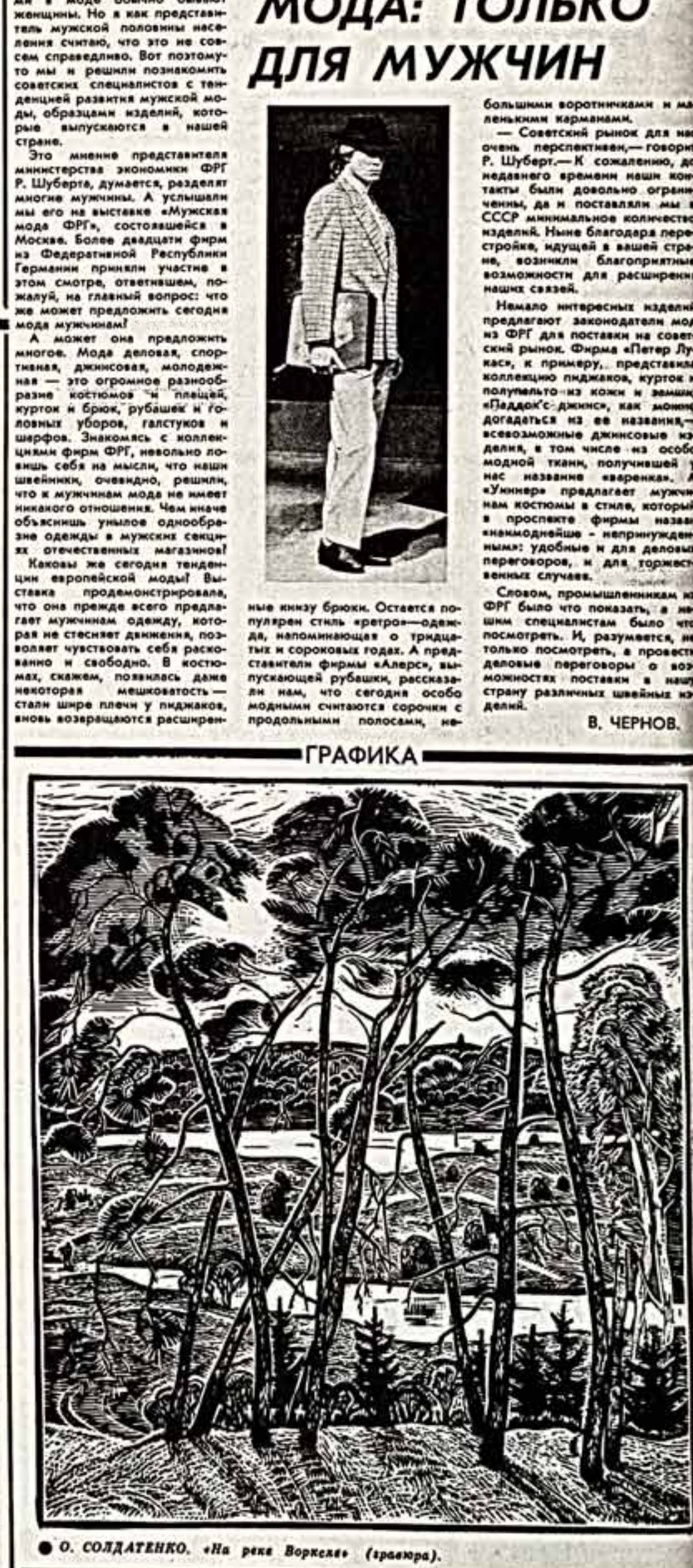
О. СОЛДАТЕНКО. «На реке Ворскле» (граюра).