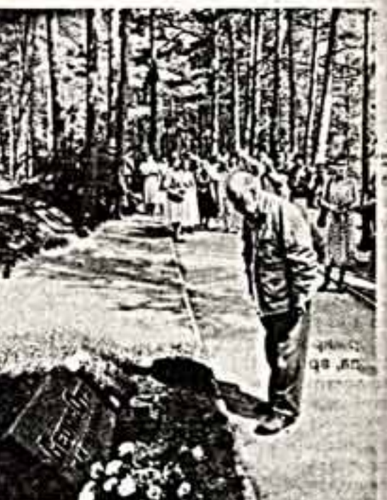
Традиционные Дни музыки имени Георга Отса состоялись в Таллине. В концертном зале «Эстония» исполнился оратория Р. Тобиса «Послание Ноаме». После выступления. В центре — главный дирижер ГАТ «Эстония» народный артист СССР Эри Клас. На могиле знаменитого певца. Память Г. Отса почтает Павел Лисицкий.