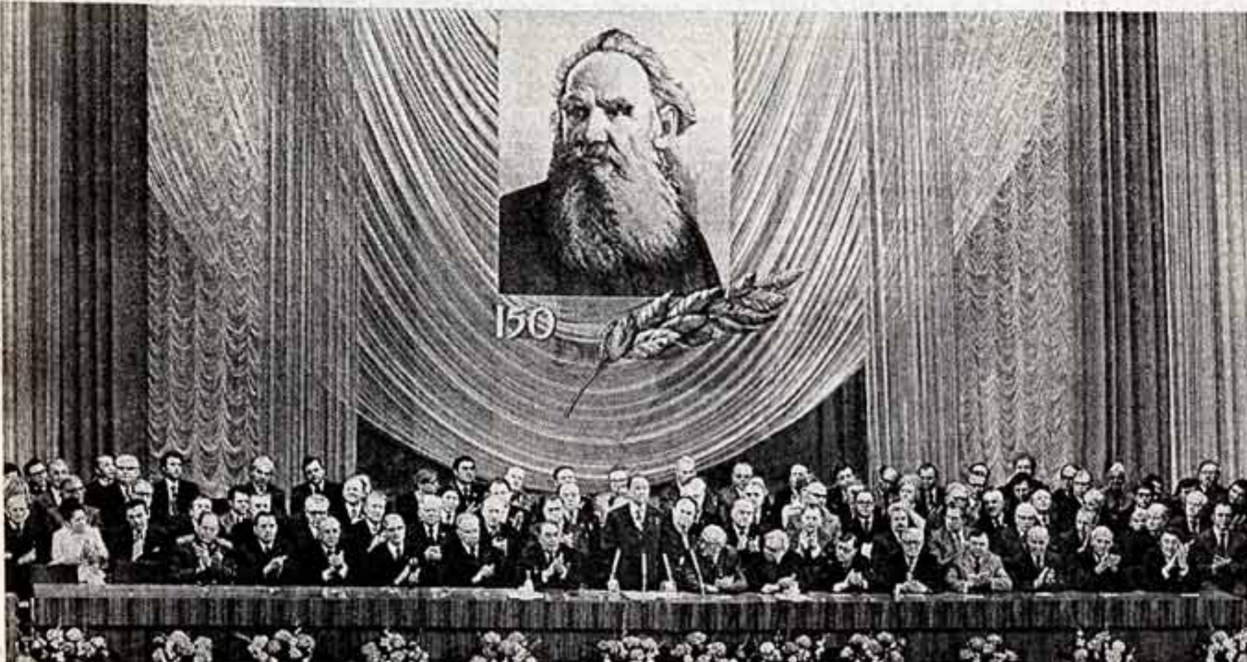
В президиуме торжественного вечера, посвященного 150-летию со дня рождения Л. Н. Толстого.