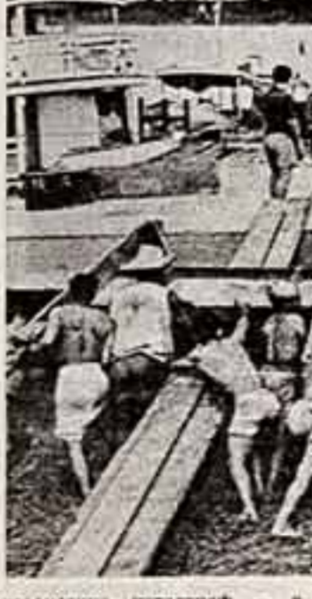
Кадр из фильма.