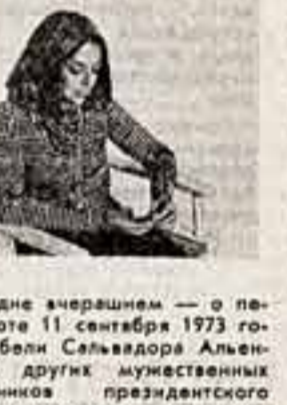
Кадр из фильма.