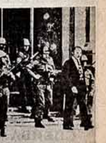
Кадр из фильма.