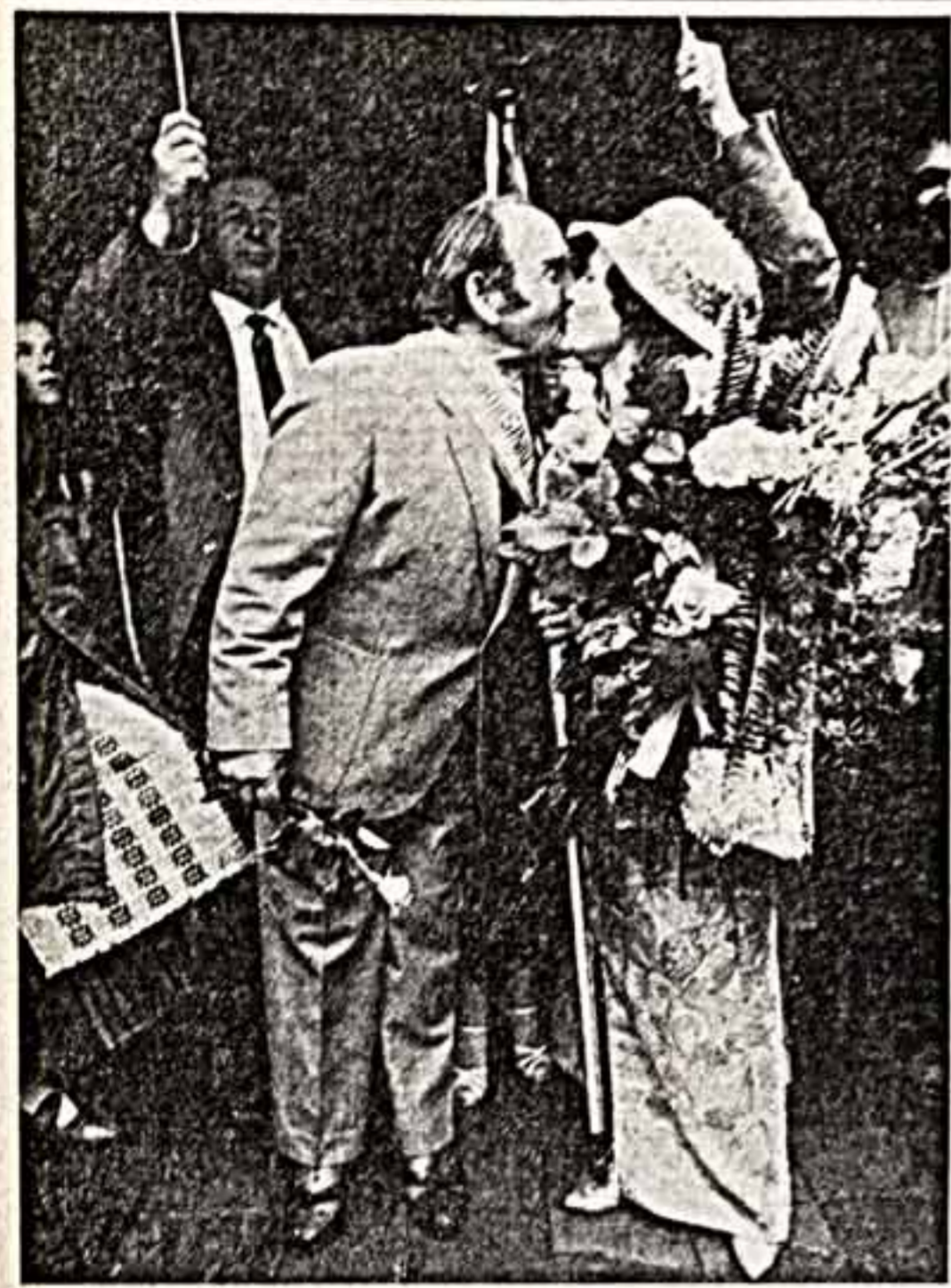
Традиционным стал Праздник семьи, который устраивается на старинной Ратушной площади в Каунасе. Участниками этого праздника становятся не только молодые люди, вступающие в брак, но и тысячи горожан, которых привлекает сюда атмосфера веселья, любви...

—Древнее здание по лестнице — удивительное сооружение. В подвале, да так и звали, оставшийся темной. Лишь слабый свет углей в горне освещает музичку. В его облеская видны натуральные локоны английского парка и раззолоченный паркет озвучивает. А внизу — просвечивающиеся сквозь решетку потные спины рабочих у напольных замурованных полов, по которому от стены протянулись кандалы цепи каторжан.