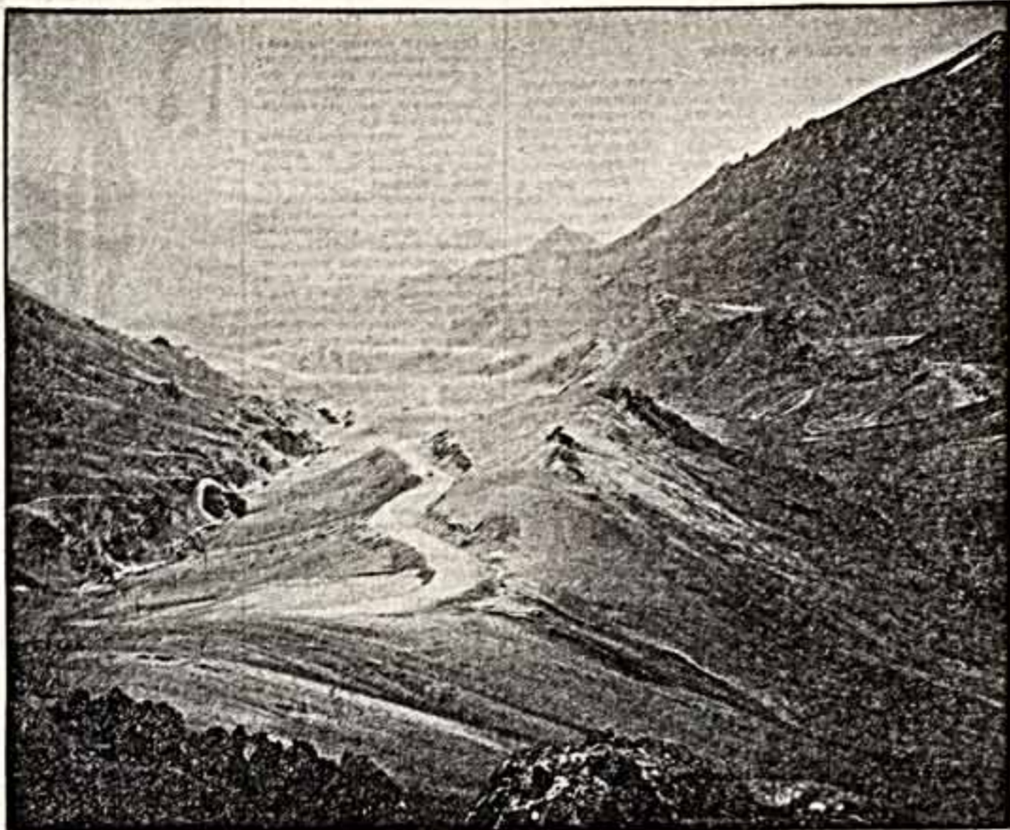
ФОТОКОНКУРС С. Т. Телюфеев. «Панорама дельты».