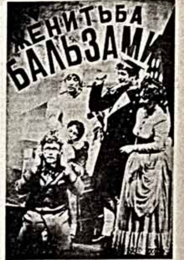
В драматическом театре имени М. Горького в Челябинске режиссер спектакля по пьесе А. Островского «Женитьба Бальзамова» С. Суров на спектакле.