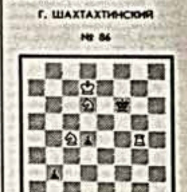
Г. ШАХТАХТИНСКИЙ № 86

РЕДАКЦИОННАЯ КОЛЛЕГИЯ Наш адрес: 101484, ГСП-4, Москва, Новослободская улица, дом 73. Телефон для справок: 285-78-02.