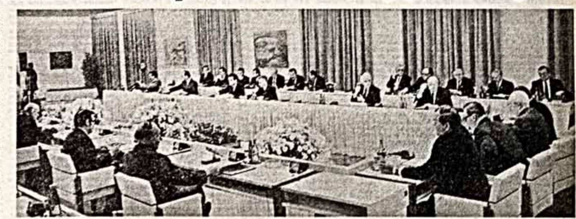
Во время встречи.

совместно разработанных многонаправленных позиций стран социалистического содружества, сделанных Генеральным секретарем ЦК КПСС в ходе женевской встречи. Было единодушно отмечено, что состоявшийся в ходе встречи прямой, откровенный разговор был необходим и его итоги являются полезными. Хотя в Женеве не удалось решить конкретные проблемы ограничения и сокращения вооружений, важное значение имеет то, что на встрече была подтверждена достигнутая в январе 1985 года советско-американская договоренность о необходимости искать пути предотвращения гонимых вооружений в космосе и ее прекращения на Земле. Принципиально важным является содержание женевской встречи и ее итогов, документально зафиксированных в совместном заявлении о недопустимости ядерной войны и об отказе сторон от достижения военного превосходства. Большое значение женевской встречи и в том, что она положила начало диалогу с целью добиться перемены в лучшую сторону советско-американских отношений, за которые воюем. В целом результаты встречи М. С. Горбачева с Президентом США Р. Рейганом создают более благоприятные