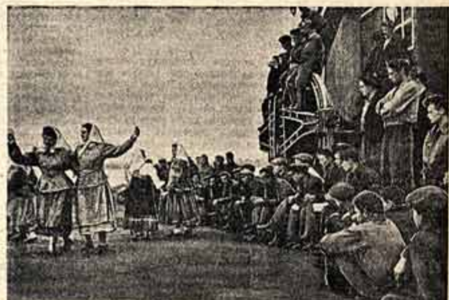
Эту радостную встречу запечатлел М. Володин (на снимке слева), прибывший в район великой стройки в составе бригады московских художников, возглавляемой П. Соколовым-Савиным.