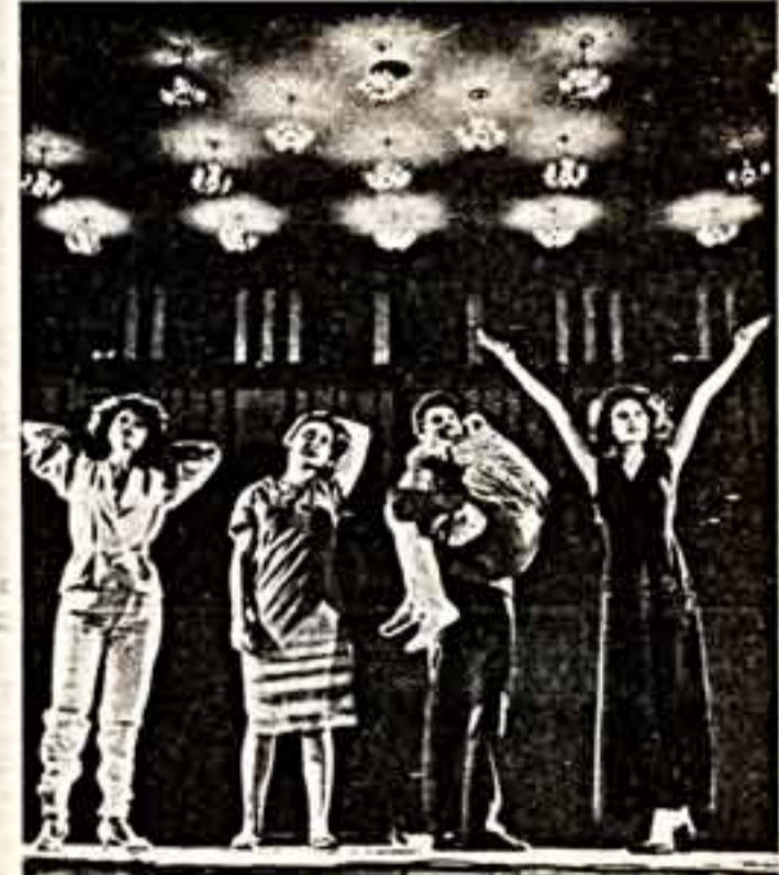
Надо знать, когда уходить. Как у вас в песне: «Надо знать, когда уходить, когда больше нет?»