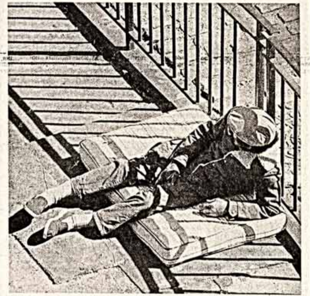
Нью-Йорк. Бездомный. Один из ста тысяч американцев, выброшенных Кришн над головой в этом крупнейшем городе США.