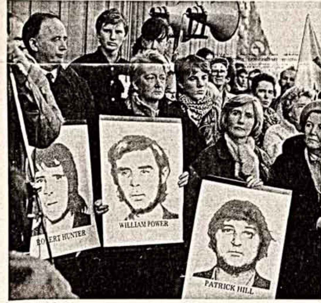
Дублин. Так проходила манифестация в защиту ирландского шестерки, «гилфордской шестерки» — ни в чем не повинных людей, незаконно брошенных за решетки.