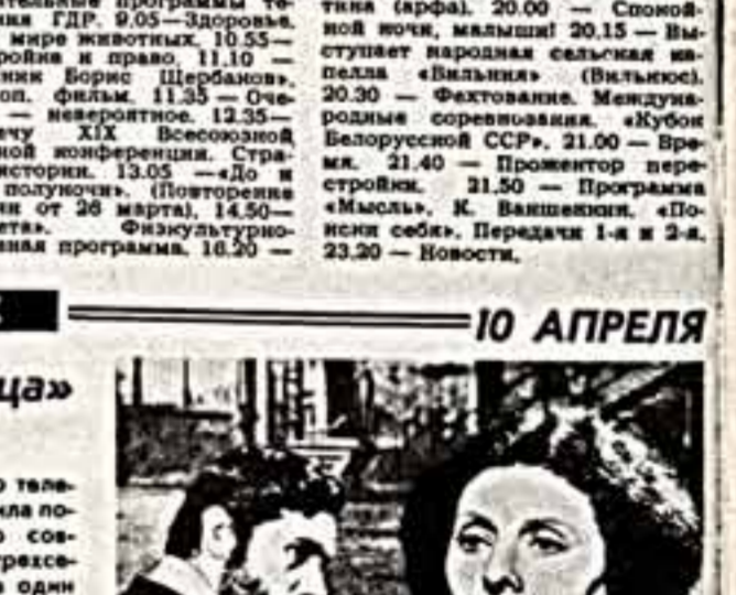
Кадр из фильма.