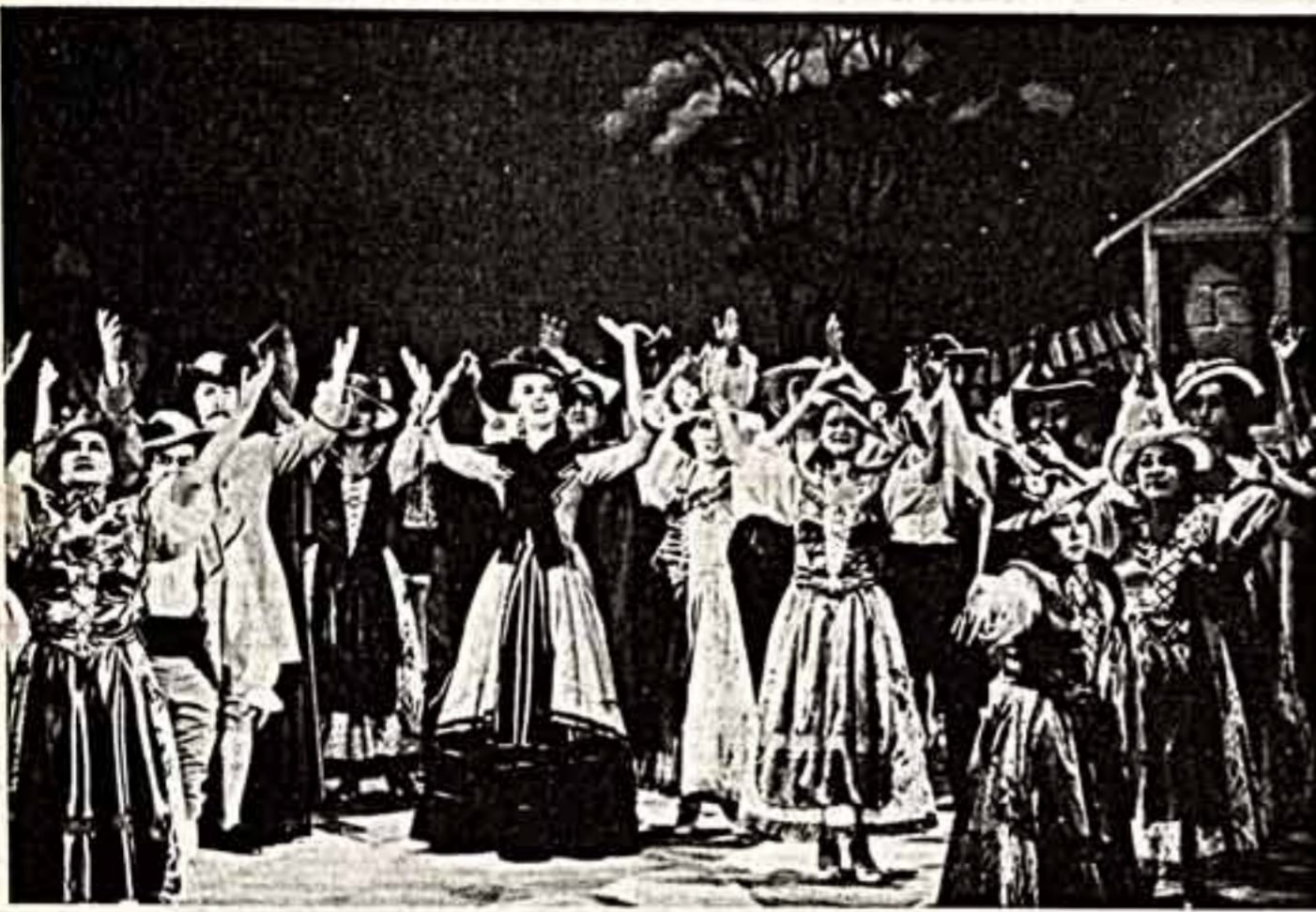
Бурятский государственный академический театр оперы и балета показал новую работу — премьеру комической оперы Г. Доминетти «Дочь полка».