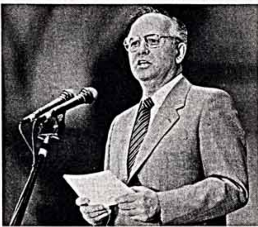
Во время митинга дружбы польской и советской молодежи в городе Кракове.