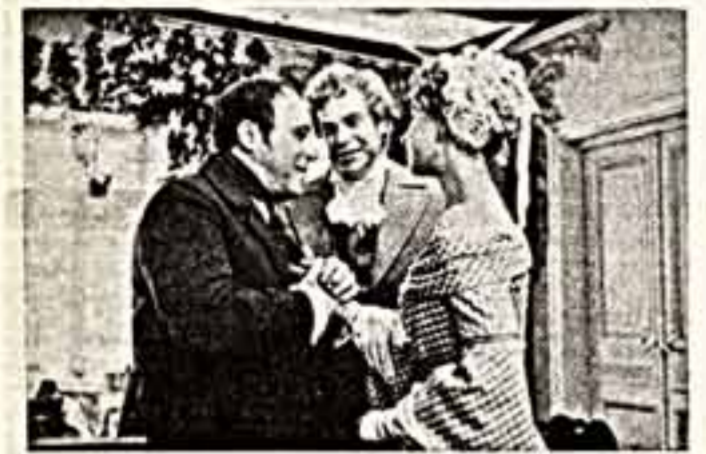
— 1 пр., 19.50. По многочисленным просьбам зрителей вновь на телеэкране телевизионный художественный фильм «Мертвые души»...