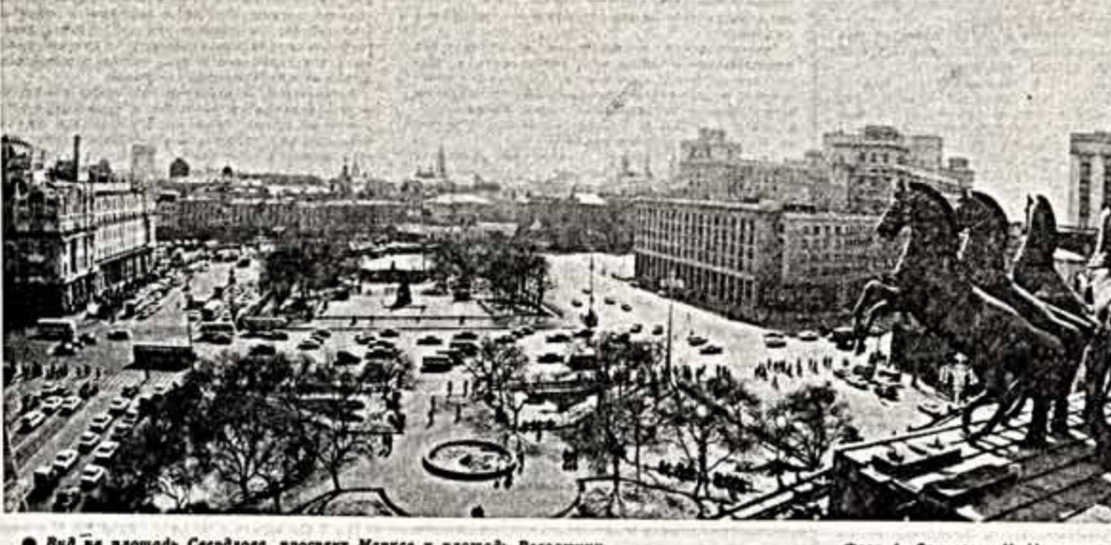
Вид на площадь Свердлова, проспект Маркса и площадь Революции.