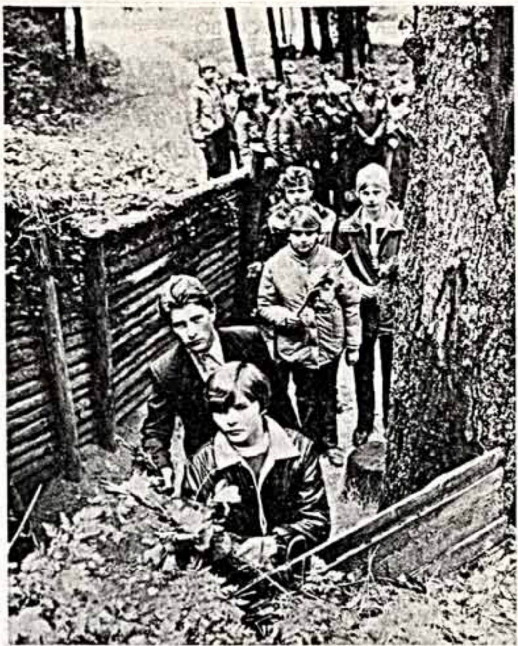
Многие славные строки в летопись Великой Отечественной войны внесли брацкие партизаны. И сегодня на Партизанскую поляну-памятник, что неподалеку от Брянска, приходят тысячи людей.

И вот теперь, когда многие клубы в домах культуры, особенно в сельской местности, находятся в неудовлетворительном состоянии.