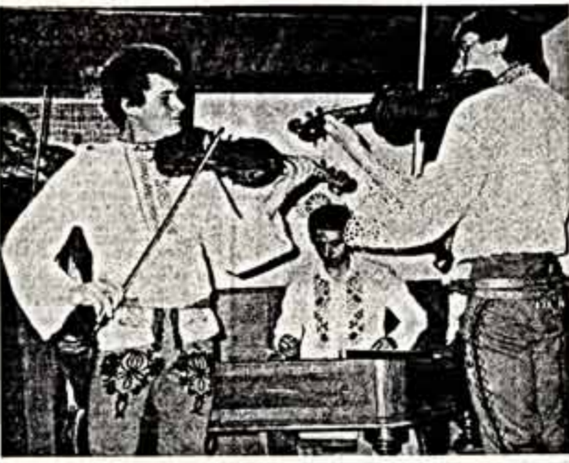
ЧЕХОСЛОВАКИЯ: ЛЕТО, СЕЗОН ГОСТЕЙ