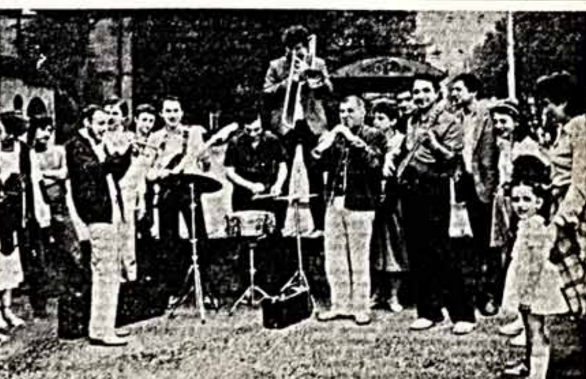
В Тбилиси состоялся всеобъемлющий фестиваль джазовой музыки «Тбилиси-86». В нем приняла участие свыше сорока коллективов из 18 городов нашей страны, а также музыканты из Польши, Венгрии, Чехословакии, ГДР, Болгарии. В течение 10 дней большой Группы ГИТИС в центре внимания любителей джаза, все концерты проходили в большом успехе. Фестиваль был организован филармонией Тбилисской студии грамзаписи «Мелодия» и Министерством культуры Грузии.