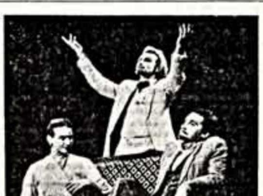
Студенты играют Чехова