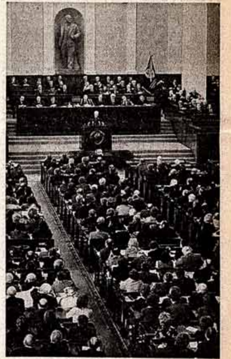
Москва, Большой Кремлевский дворец. В зале заседания III съезда кинематографистов СССР.

С отчетным докладом правительства Союза кинематографистов СССР выступил Л. А. Кулиджанов (доклад публикуется в сегодняшнем номере нашей газеты).