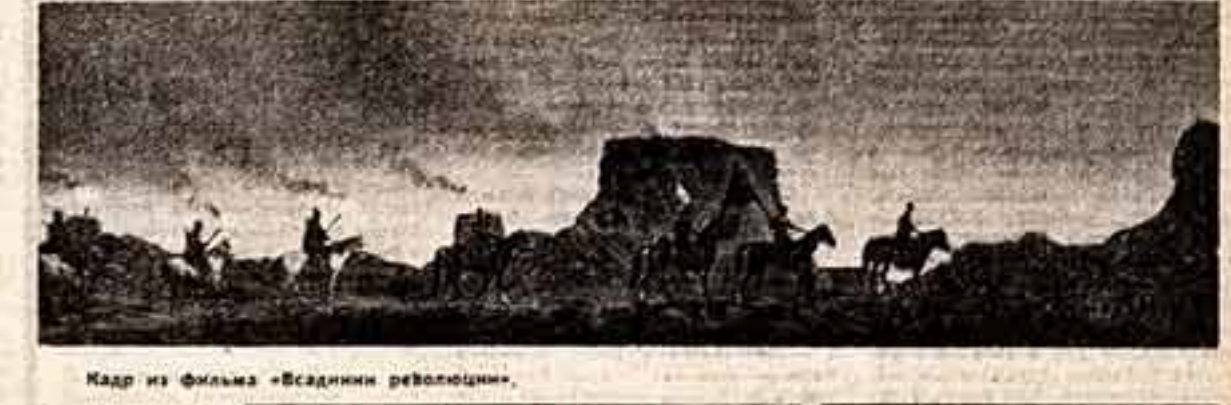
Кадр из фильма «Всадники революции».

После завершения Дворца искусств гостеприимно распахнутся перед участниками и гостями Первого международного кинофестиваля стран Азии и Африки в Ташкенте.