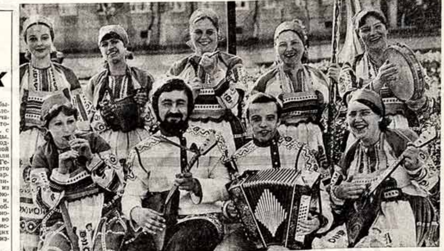
Веселую программу подготовил народный коллектив «Текстильный край» Новоосинского областного Дома культуры...