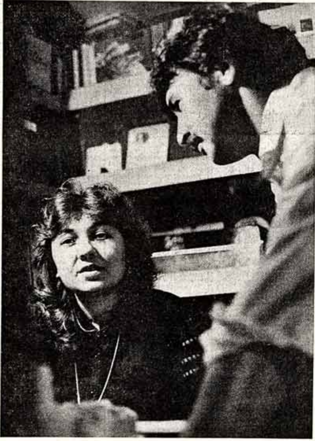
СЕКUNDA НА ПОДВИГ