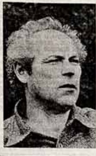
самому вести крестьянское хозяйство.