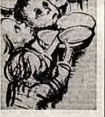
Рисунки К. Колмыц «Технический завод в Германии» (1924).