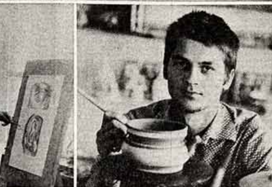
Красивы и самобытны изделия, созданные руками художников Гжели. Затеявшие чайники, самовары, вазочки пользуются большим спросом не только в нашей стране, но и за рубежом.