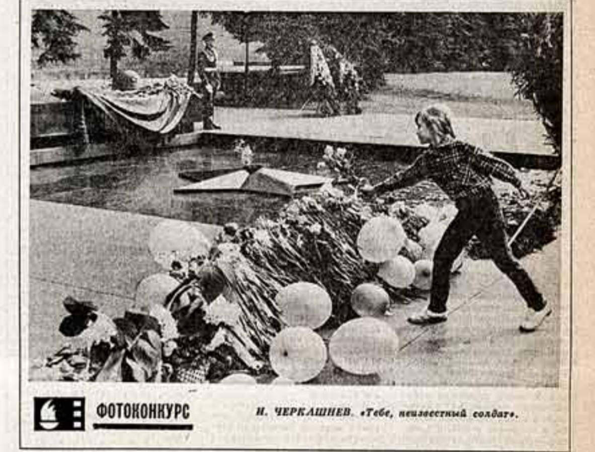
ФОТОКУРС И. ЧЕРКАШНЕВ. «Тебе, неизвестный солдат».

И по типологическим признакам, независимо от конкретных местных условий. Строительные нормы и правила также не различают местных природных особенностей. Перед архитекторами стоит, по существу, неразрешимая задача централизованной разработки сельских домов на все случаи жизни, для самых различных регионов страны. Похоже, что уроки массового городского строительства вовсе не пошли впрок строительству сельскому. С начала шестидесятых годов большие десятилетия последовательной перестройки типологических и конструктивных особенностей типологического проектирования и индустриального строительства в сельской местности на основе принципов комплексной региональной типологии. Суть дела состоит в том, чтобы строить не для села «вообще», а для конкретных, конкретных по своим природно-климатическим условиям локальных сельских регионов. Для этого надо собрать и систематизировать сведения о природных, социально-исторических, демографических и других важных особенностях развивающихся сельских поселений и на основе этих сведений разработать региональные серии типовых проектов.