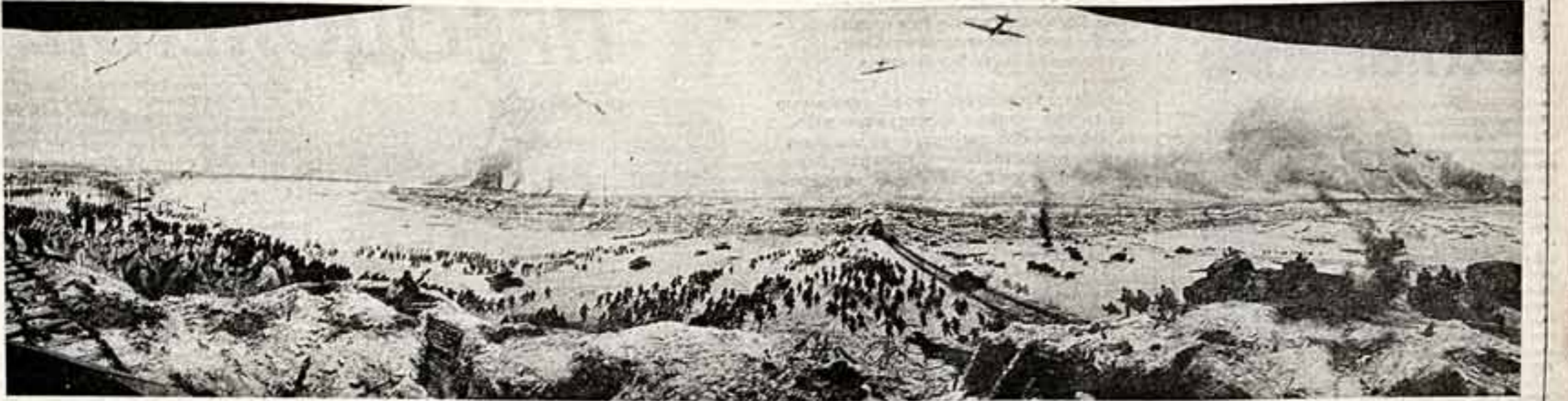
И. ПАВЛОВ. Так выглядят диорама «Прорыв блокады Ленинграда».

К 40-летию Победы в Великой Отечественной войне 1941—1945 годов в городе на Неве открыта первая на ее берегах диорама «Прорыв блокады Ленинграда».