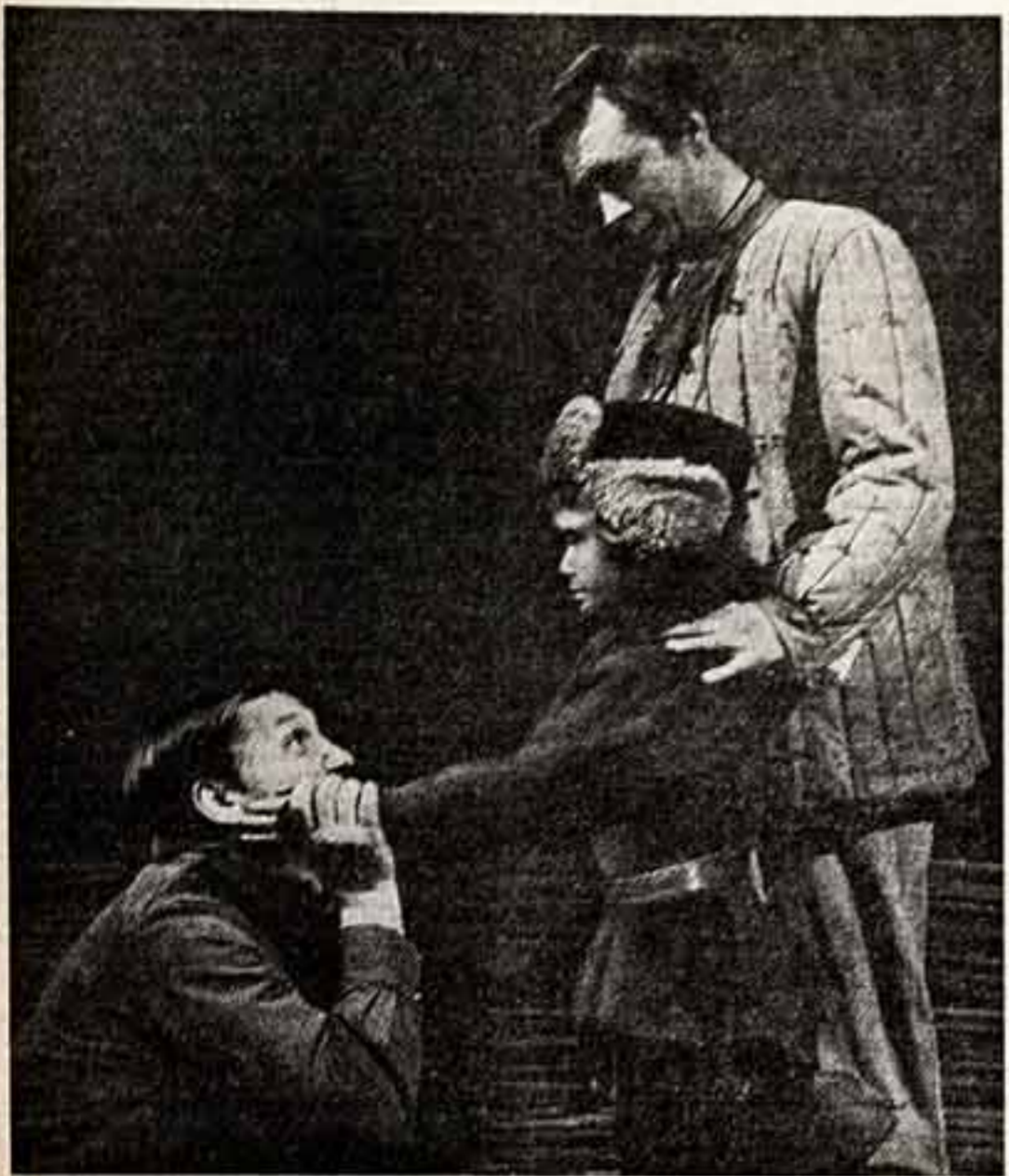
Ростовский академический театр драмы имени М. Горького показал в Москве, на сцене филармонии МХАТ, спектакль «Судьба человека» Михаила Шолохова...