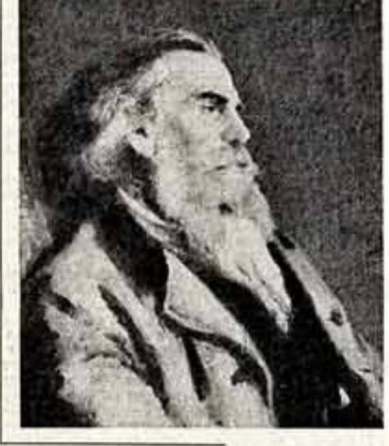
Было много и других покровителей. И теперь друзья, ныне поступавшие в частных собраниях экспонатов значительную часть всех 16 тысяч экспонатов музея.

Вряд ли великий наш соотечественник Александр Николаевич Радищев, кому принадлежит эти вещи слова, все же предполагал, что именем его будет назван музей — памятник революционеру и памятнику русскому искусству, который торжественно отмечает свое столетие.