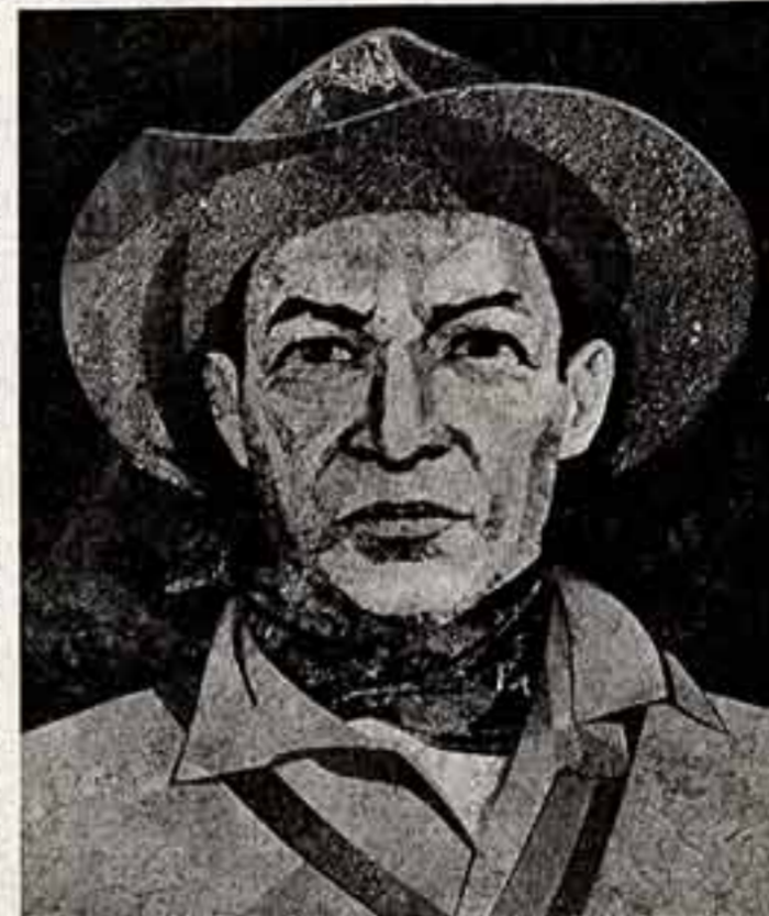
портрет Аугусто Сесара Сандино, выдающегося революционера и героя борьбы за свободу и независимость Никарагуа