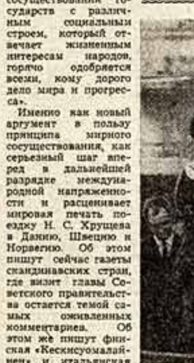
ДЕНЬ 19-й ОСЛО. 4 июля, по окончании официального визита в Норвегию, Председатель Совета Министров СССР Н. С. Хрущев и сопровождающие его лица отбыли на теплоходе «Вашкирия» в Россию...