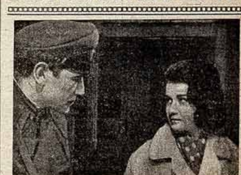
Кадр из фильма «До города недалеко».