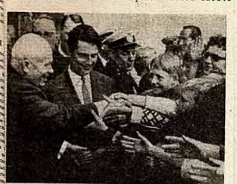
ДЕНЬ 1-й КОПЕНГАГЕН. Ители датской столицы тепло встречают в аэропорту Председателя Совета Министров СССР Н. С. Хрущева...