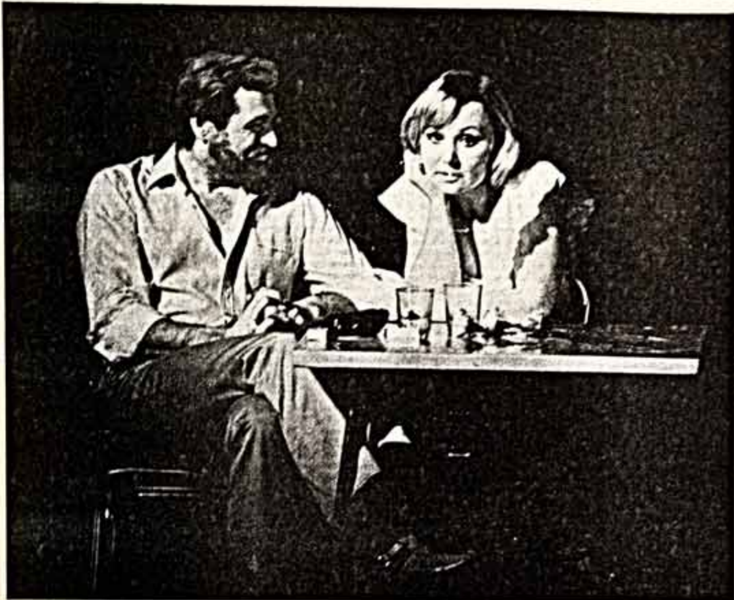
ТЕАТР, ДЕТИ И МЫ