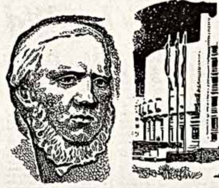
На центральной рисунке — фрагмент мемориальной доски Михаилу Салтыкову-Щедрину, на последнем рисунке вид здания дворца «Установление Советской власти в городе Рустин А. Михайлова.

Уже помогло. Взять хотя бы, к примеру, премьерный спектакль «Музыкальный гороскоп» студии ансамбля в концертном зале гостиницы «Космос». То, что делалось обычно в течение нескольких месяцев — сценарий, декорации, костюмы, — было готово за десять дней. Пришлося, правда, организаторам покрутиться, но как заметил Игорь Гранов, он всегда встречал понимание и поддержку. А это здорово.