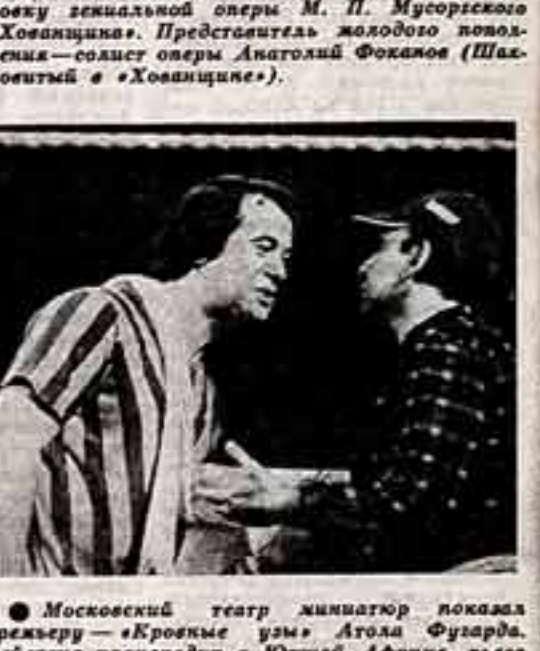
Московский театр миниатюр показал премьеру «Кровные узы» Атолы Фузурова. Действие происходит в Южной Африке, являясь обличьем расизма...