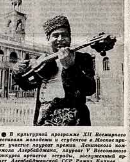
В культурной программе XII Всемирного фестиваля молодежи и студентов в Москве примет участие лауреат премии Ленинского комсомола Азербайджана...