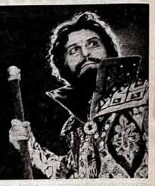
Новосибирский театр оперы в балете от- крыл свое 40-летие. Высочайшая музыкальная культура...