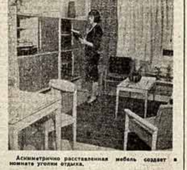
Асимметрично расставленная мебель создает в комнате уголки отдыха.