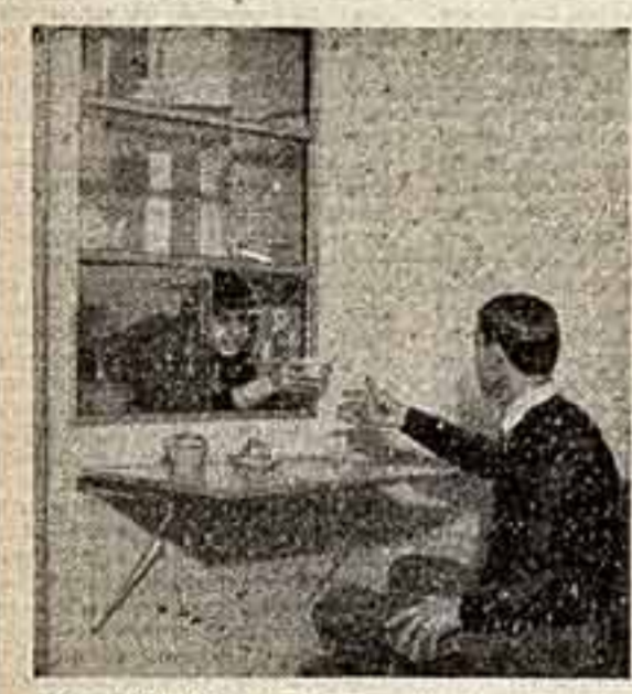
Горячий кофе прямо с плиты, на кухню бегают не надо. Это очень удобно и экономит время.

«РАБОТЫ ЛУЧШИХ АРХИТЕКТОРОВ-НОВАТОРОВ ПОКАЗЫВАЮТ, ЧТО ПРОСТЫМИ СРЕДСТВАМИ МОЖНО ДОБИТЬСЯ БОЛЬШОЙ ВЫРАЗИТЕЛЬНОСТИ И КРАСОТЫ. БОЛЕЕ ПРОСТО РЕШАТЬ ЗАДАЧУ ПОМОГАЮТ СОВРЕМЕННЫЕ ИНДУСТРИАЛЬНЫЕ КОНСТРУКЦИИ И МАТЕРИАЛЫ. АРХИТЕКТУРНО-ХУДОЖЕСТВЕННЫЕ ФОРМЫ ДОЛЖНЫ БЫТЬ РАЗУМНЫМИ, НОВАТОРСКИМИ И ЭКОНОМИЧЕСКИ ЦЕЛЕСОБНЫМИ...» Н. С. ХРУЩЕВ «Развитие экономики СССР и партийное руководство народными хозяйствами»