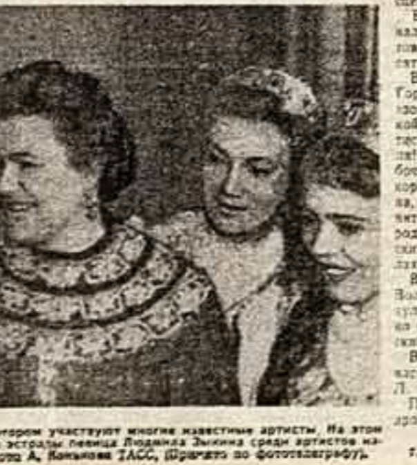
В ГОРЬКИНОМ проходит фестиваль советской эстрады, в котором участвуют многие известные артисты. На этом фестивале эстрады молодость заняла свое достойное место...