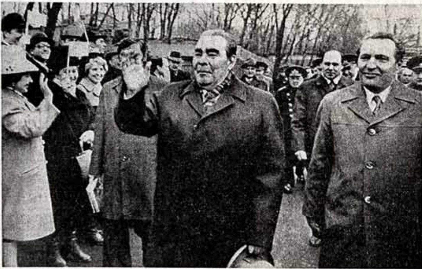
6 апреля во Владивостоке прибыл Генеральный секретарь ЦК КПСС, Председатель Президиума Верховного Совета СССР Л. И. Брежнев. Во время встречи во Владивостоке.

Генеральный секретарь ЦК КПСС, Председатель Президиума Верховного Совета СССР Л. И. Брежнев посетит ФРГ с официальным визитом в начале мая с. г.