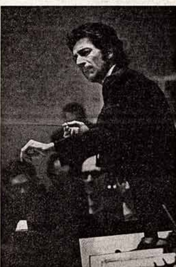
фотоконкурс В. БОГДАНОВ. «Диржирует Юрий Темирканов». И. КОШЕЛЬКОВ. «Праздничная Москва вечером».