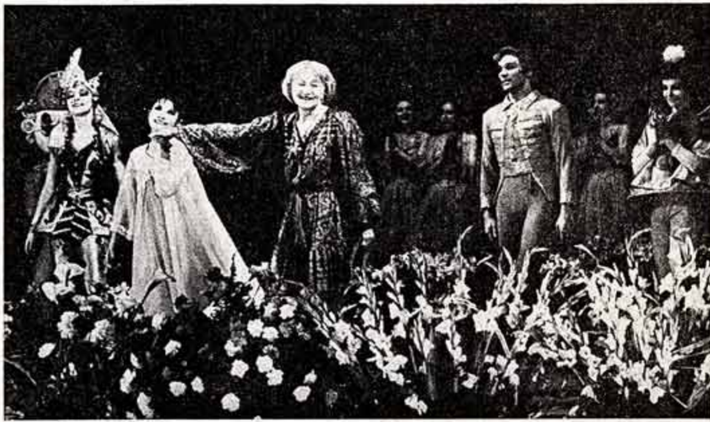
Все цветы — Галине Сергеевне.

Искусство социалистического реализма остается нашим незыблемым спутником на всю жизнь.