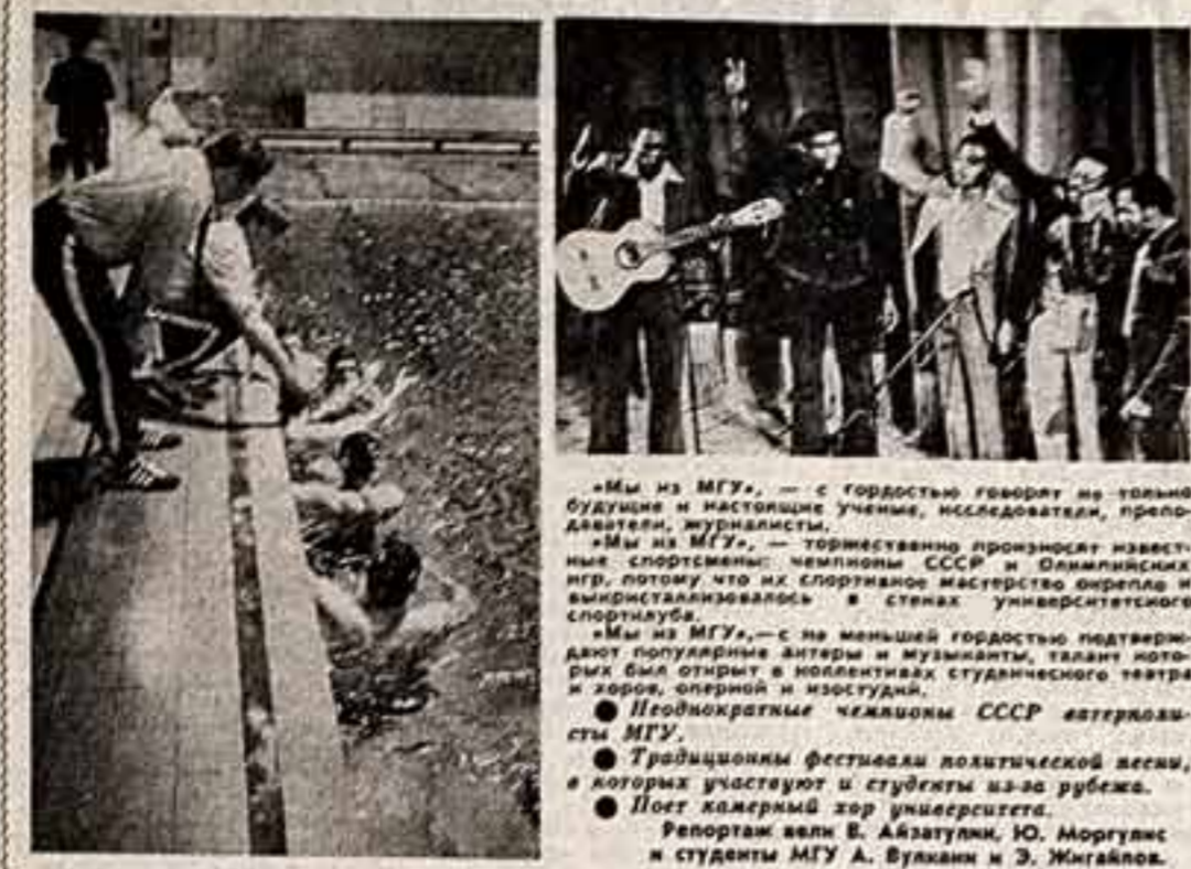
«Мы из МГУ...» с гордостью говорят на торжественных собраниях и историческом учении, исследователи, преподаватели, журналисты.