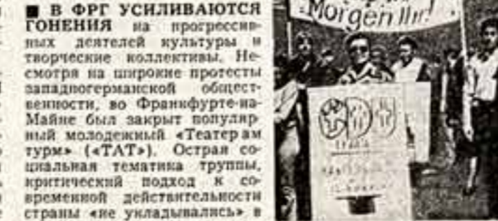
Участники демонстрации протеста против преследования театра «LAT».

В ФРГ УСИЛИВАЮТСЯ ГОНЕНИЯ на прогрессивных деятелей культуры и творческие коллективы. Несмотря на широкие протесты западногерманской общественности, во Франкфурте-на-Майне был закрыт популярный молодежный «Театр ам тур» («Т.А.Т»). Остраивая социальная тематика труппы, критический подход к современной действительности страны «не укладывались» в рамки культурной политики представителей ХДС — партии крупного капитала, которые занимают главенствующие позиции в городском самоуправлении.