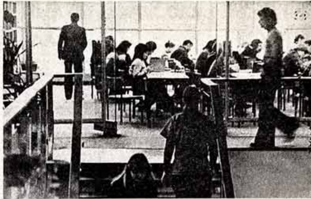
Свыше двадцати тысяч студентов (только дневного отделения) ежедневно заполняют аудиторию и библиотеку университета, учебную и научную работу которого осуществляют более 250 кафедр и 350 лабораторий.

ведет председатель научного совета АПН СССР по проблемам эстетического воспитания Герой Социалистического Труда Сергей ГЕРАСИМОВ