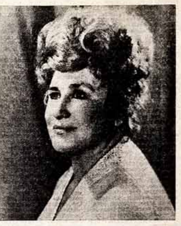
Галина МАРКИНА, народная артистка Белорусской ССР