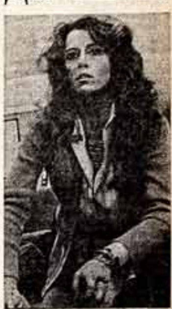
Джейн Фонда в одном из своих голливудских фильмов — «Китайский синдром».