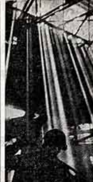
Моему заводу исполнилось сегодня сто лет.

Когда я впервые по Золоторосскому валу и выходя кирочные прокопанные стены марьенского цеха — бывшему марьенскому цеху — чувствую, что завод очень стар.