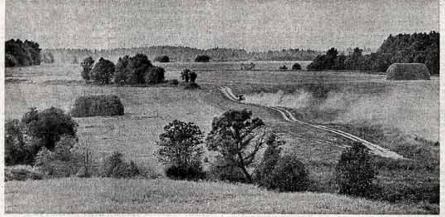
фотоконкурс • И. ДРОВОВ. «Земля Смоленская».