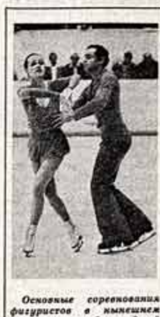
Основные соревнования фигуристов в империале фигуристов в империале фигуристов...

Давным-давно мы перестали газетными страницами года с оптимистическими видами спорта.