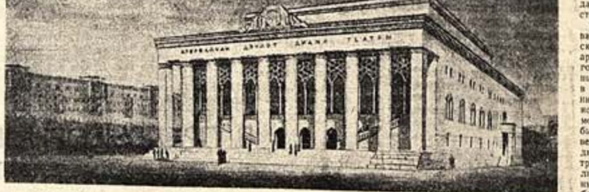
Азербайджанский Государственный драматический театр в Баку. Проект архитектора Г. Али-Заде.