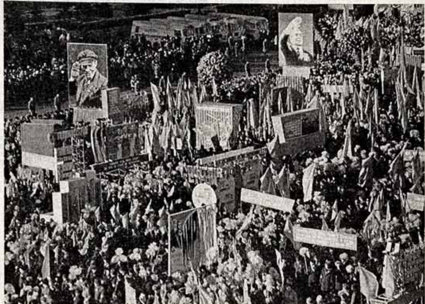
Москва. Красная площадь. 7 ноября 1978 года. Фото С. Слезнев.

Из предприятий Государственного комитета СССР по телевидению и радиовещанию Красных знамен удостоены коллектив Ленинградского киностудии «Связь», а также коллектив «Промсвязь», а также коллектив «Связь» в Ленинграде и коллектив «Связь» в Москве.