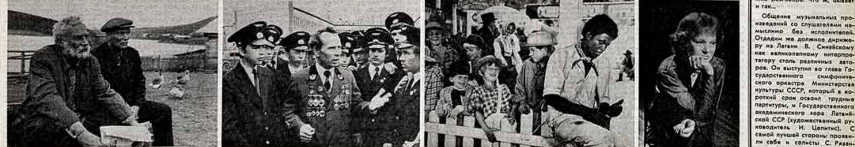
Кадры из фильмов: «Вечный зов», «Егор Иванович», «Приключения Тома Совера», Л. Гурченко в фильме «Песни военных лет».