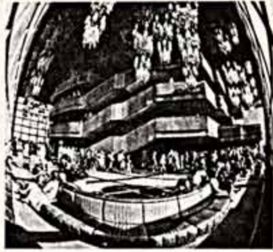
крылато народу подлинное сокровище культуры.