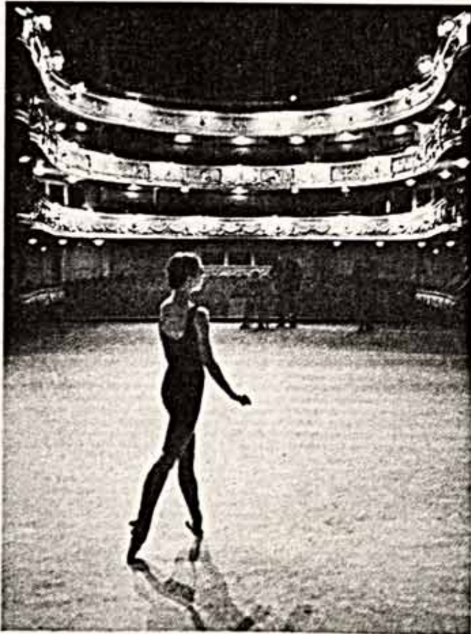
«В ПОНСКЕ ОБРАЗА». (На репетиции балета «Вальдер» в Свердловском академическом театре оперы и балета имени Луначарского).