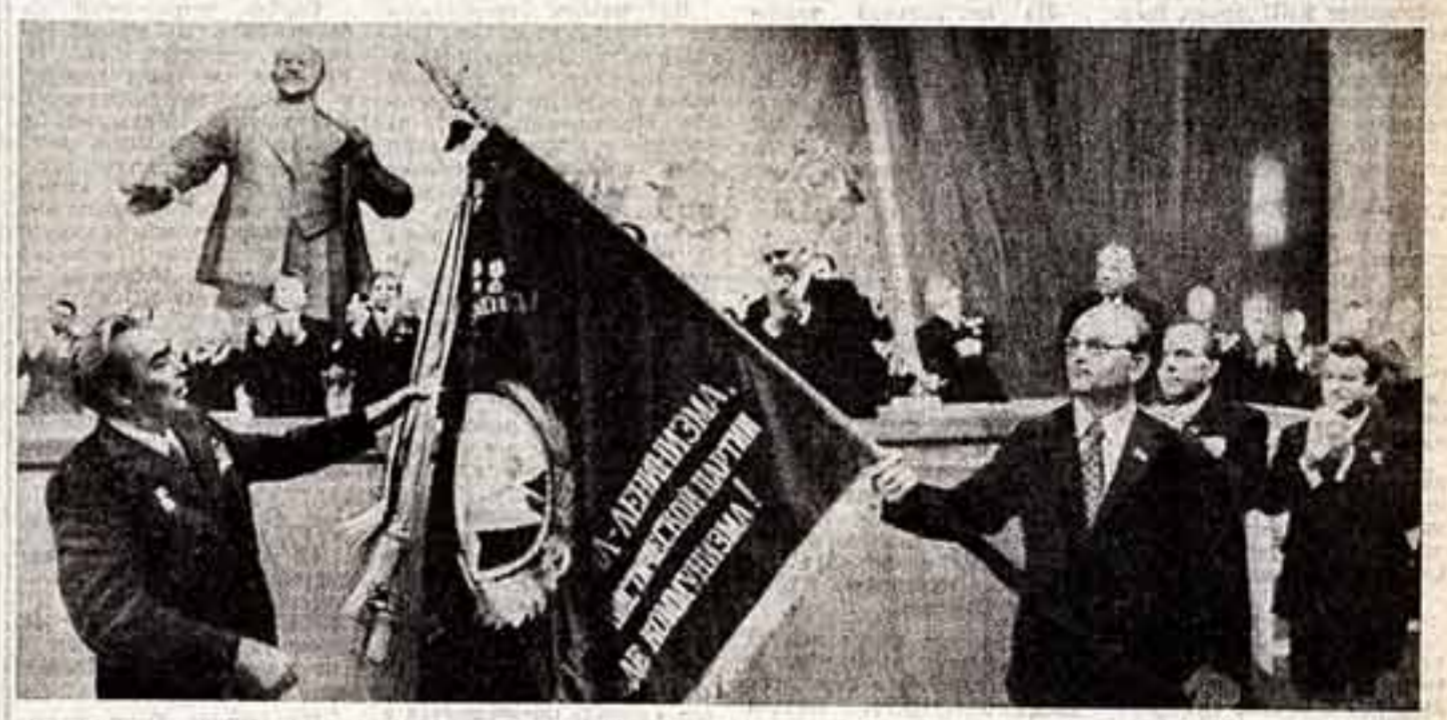
Кишинев, 11 октября. Торжественное заседание Центрального Комитета Коммунистической партии Молдавии и Верховного Совета Молдавской ССР, посвященное 50-летию образования Молдавской ССР и создания Коммунистической партии Молдавии. Генеральный секретарь ЦК КПСС Л. И. Брежнев прикрепляет орден Октябрьской Революции к знамени республики.