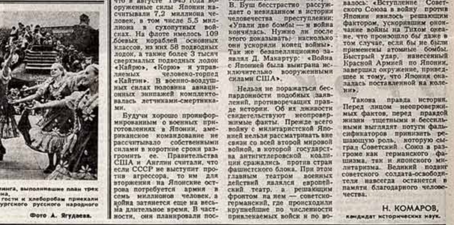
Колхозы «Прогресс», имени Цемалкина, выполнившие план трех лет пятилетия по заготовкам зерна. На празднике «Урожай-83» в гости к хлеборобам приехали армия Государственного Оренбургского русского народного хора.

И ЮНЬСКИЙ Пленум ЦК КПСС всесторонне рассмотрел и проанализировал актуальные проблемы идеологической, массово-политической работы партии в условиях развитого социализма. Одним из важнейших выводов, сделанных Пленумом, является оценка современного этапа, когда назрели глубокие качественные изменения в производственных силах и соответствующее изменение характера отношений. Этот национальный по своему теоретическому и практическому значению вывод является фундаментальной основой подхода к анализу всего комплекса социально-экономических отношений в нашем обществе, двунаправленных сил и противоречий его развития. Решения Пленума ориентируют ученых-обществоведов на более активный поиск путей и методов, позволяющих выявить все внутренние резервы, которыми располагает государство для ускорения своего экономического, социального и духовного развития.