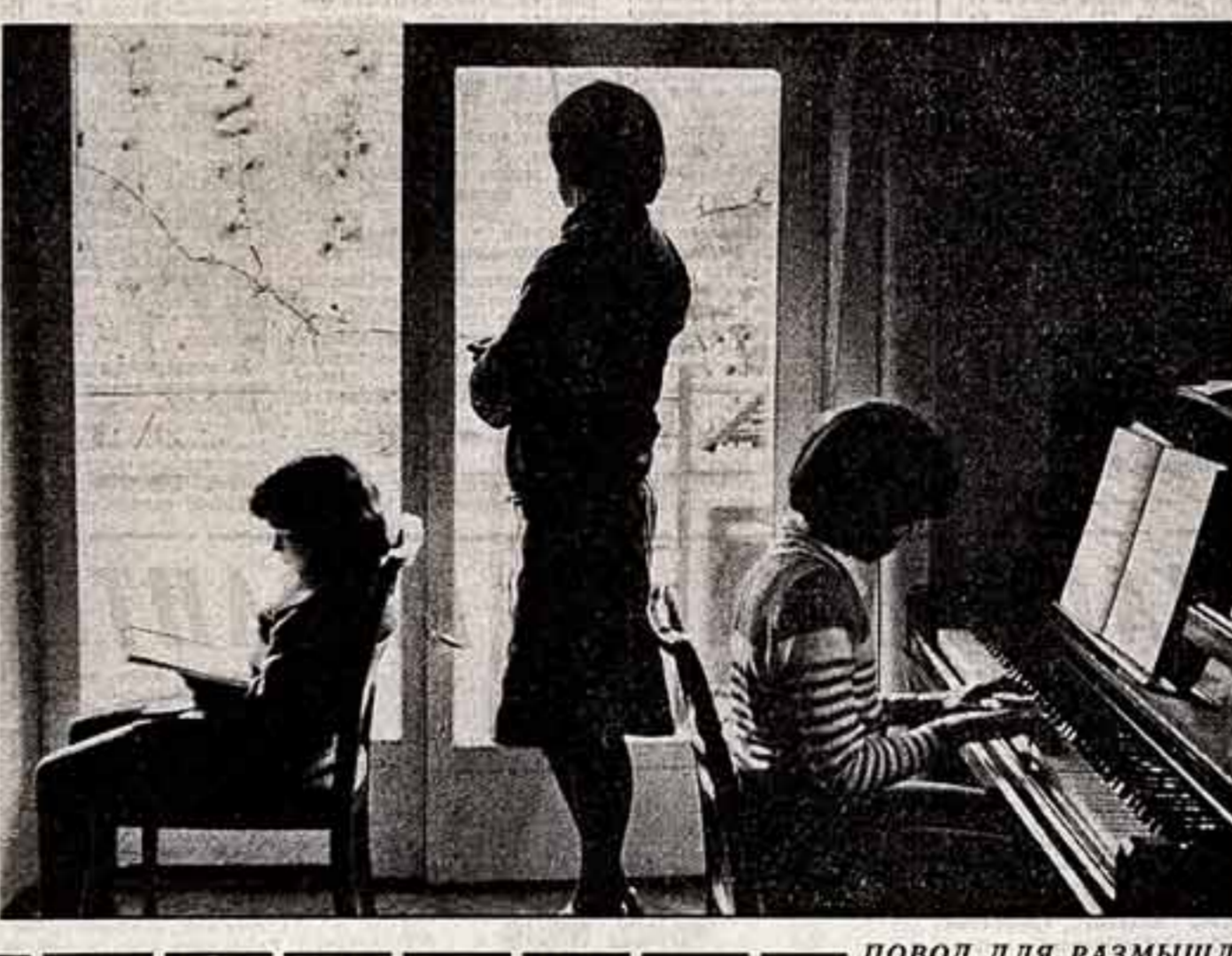
ПОВОД ДЛЯ РАЗМЫШЛЕНИЯ

Как сообщила редакция из главного управления почтовой связи Министерства связи СССР, ошибки нет. Автопортрет исполнен художником со своего изображения в зеркале, а поэтому и правая рука, в которой он держит кисть, кажется левой.