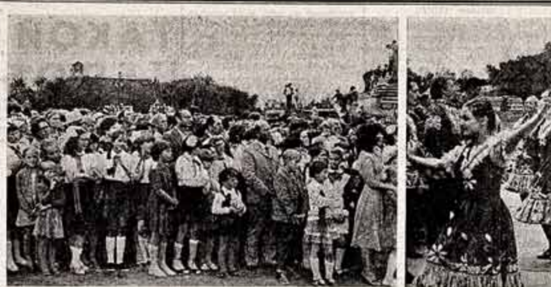
Хлеборобы Соля-Ильичинского района Оренбургской области выполняют повышенные социалистические обязательства по продаже зерна. В закрома Родины засыпано десятком тысяч тонн хлеба. Весомый вклад в эту победу внесли союзы «Юный», «Спартак».