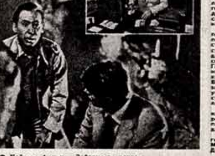
Кадр из фильма «Забавки по почте».