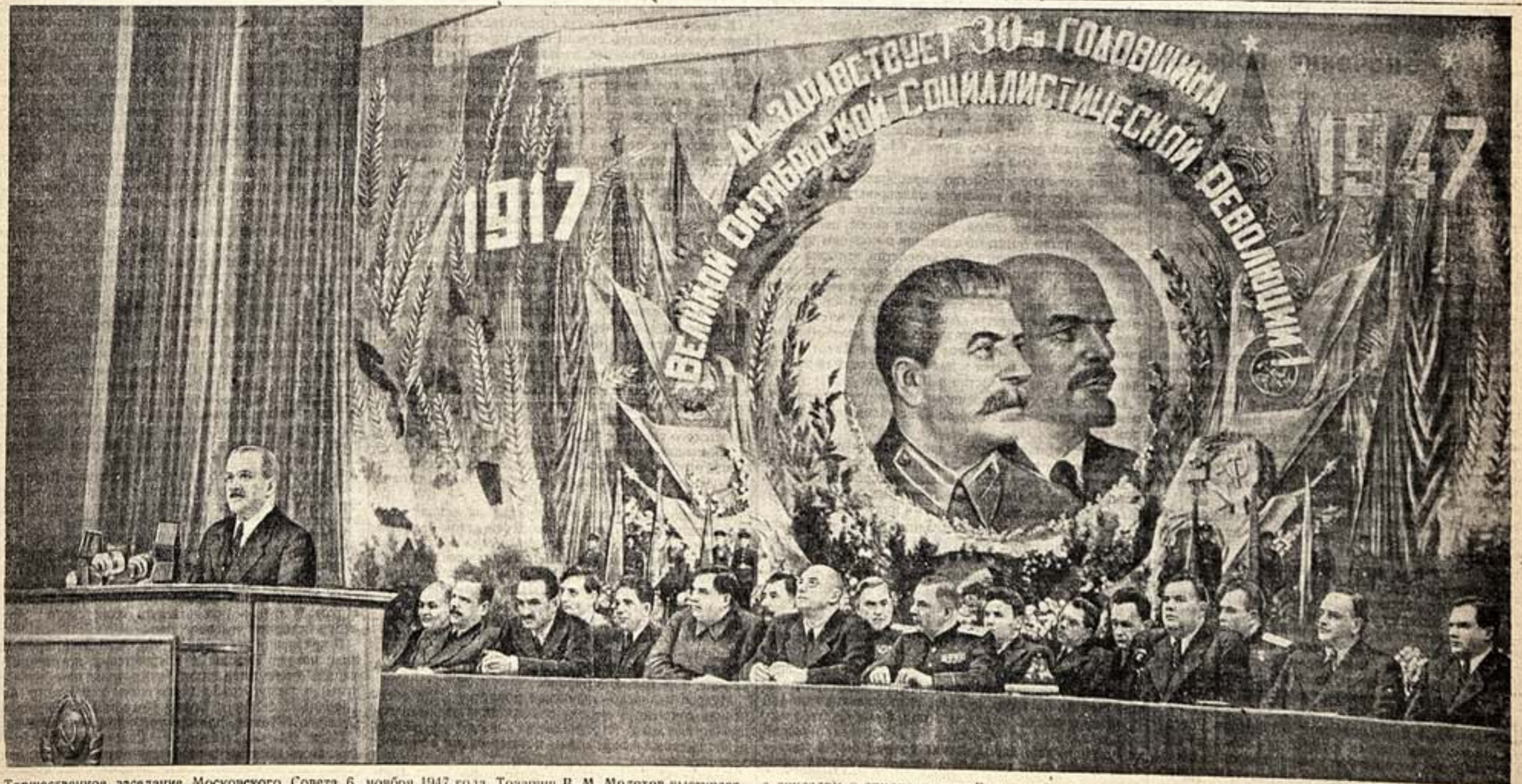
Торжественное заседание Московского Совета 6 ноября 1947 года. Товарищ В. М. Молотов выступает с докладом о тридцатилетии Великой Октябрьской социалистической революции.