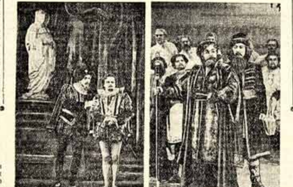
На снимках: сцены из спектаклей «Дон Карлос» (слева) и «Чародейка».