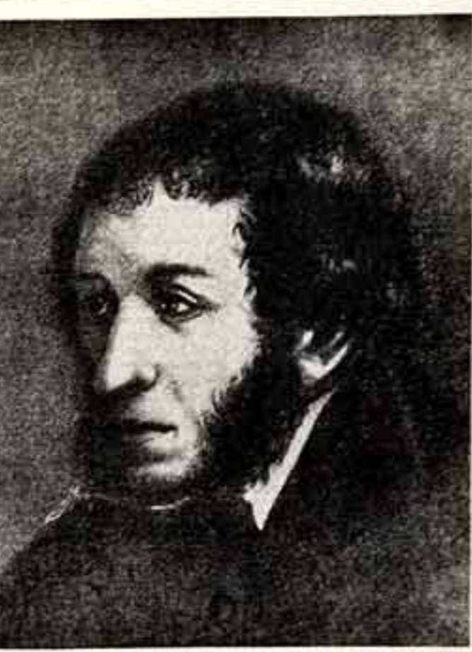
И. Л. ЛИНЕВ. Портрет А. С. Пушкина. 1836 год.