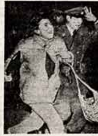
Эта молодая женщина, которую полицейский тандем и фургон вывели из дома. Она одна из участников многоточной манифестации протеста против репрессий...