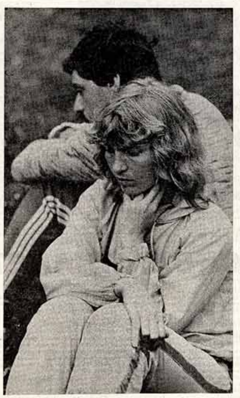
ФОТОКОНКУРС ● В. ЧИЖВИЛИ. Он в Оз.