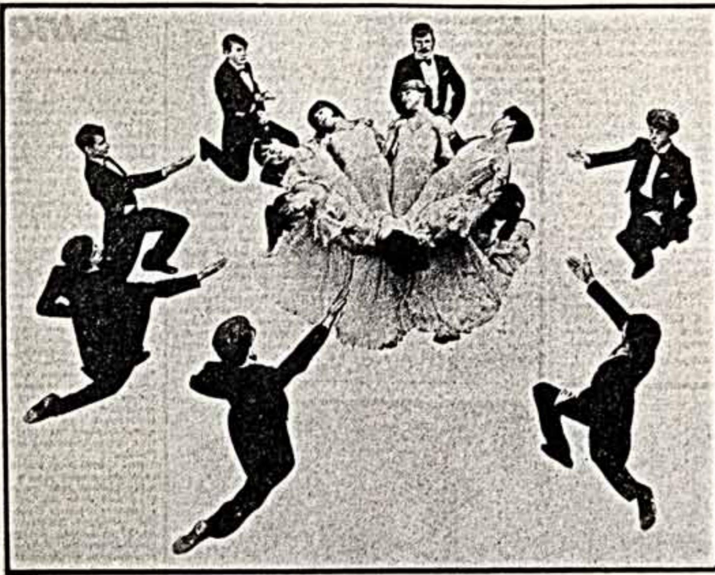
Выступает народный ансамбль современного балетного танца «Ритм» дворца культуры «Энергетик» из г. Брежнев.